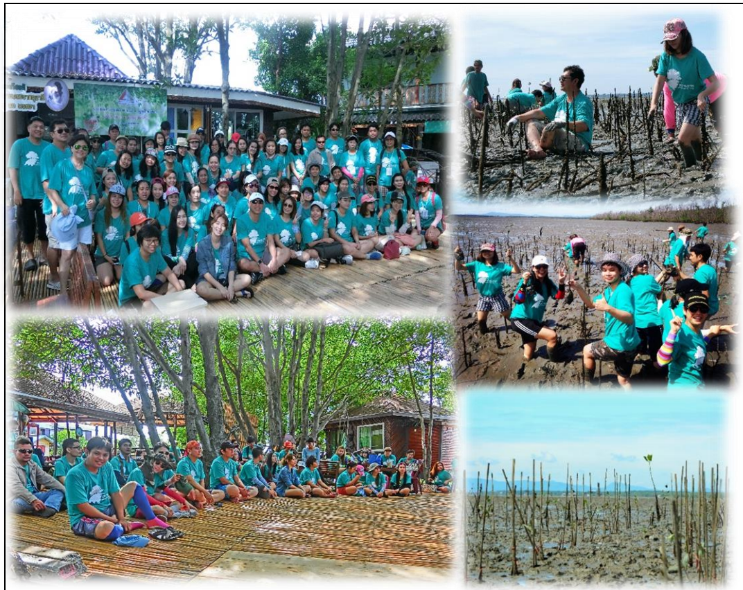
โครงการสยามราชร่วมใจปลูกป่าชายเลน ณ ศูนย์อนุรักษ์ป่าชายเลนคลองโคน จ.สมุทรสงคราม