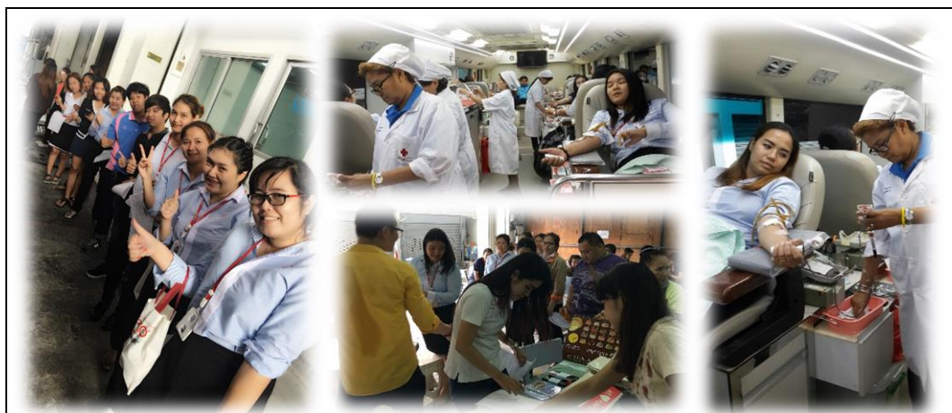
โครงการบริจาคโลหิตกับสภาอากาศ