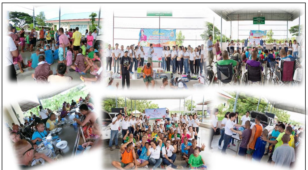
โครงการสนับสนุนการเพื่อคนพิการ ณ บ้านบางปะกง จ.ฉะเชิงเทรา

บริษัทฯ ได้ตระหนักถึงความสำคัญของการพัฒนาองค์กรไปพร้อมกับการพัฒนาชุมชน โดยการมีส่วนร่วมในการรับผิดชอบต่อสังคมทั้งทางตรงและทางอ้อม บริษัทฯ จึงได้จัดโครงการสนับสนุนการและเลี้ยงอาหารกลางวันเพื่อคนพิการ ณ บ้านบางปะกง จ.ฉะเชิงเทรา เพื่อให้พนักงานได้รู้จักแบ่งปัน ส่งเสริมและช่วยเหลือผู้ที่ด้อยโอกาสใน วันที่ 7 ตุลาคม 2559 ซึ่งได้รับการต้อนรับและร่วมกันทำกิจกรรมจากผู้พิการเป็นอย่างดี