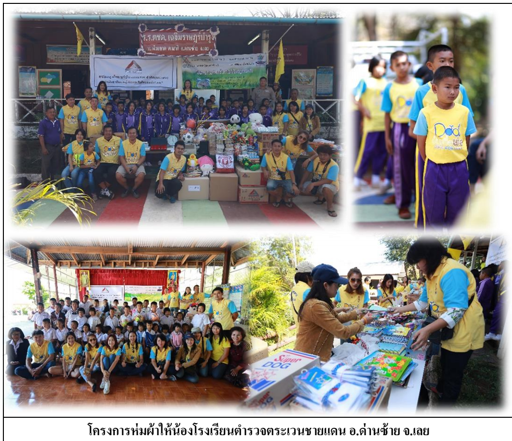
โครงการห่มผ้าให้น้องโรงเรียนตำรวจตระเวนชายแดน อ.ด่านซ้าย จ.เลย

ดังนั้น บริษัทฯ ได้ตระหนักถึงความสำคัญในการวางรากฐานการศึกษาสำหรับเยาวชน จึงได้ร่วมบริจาค สมทบทุนการศึกษาและอุปกรณ์การเรียน เพื่อช่วยให้โรงเรียนมีศักยภาพในการบริหารจัดการภายในได้ สมบูรณ์มากขึ้น ในวันที่ 15 มกราคม 2559 ซึ่งกิจกรรมนี้ได้รับความร่วมแรงร่วมใจจากผู้บริหารและพนักงาน โดยพร้อมเพรียงกัน