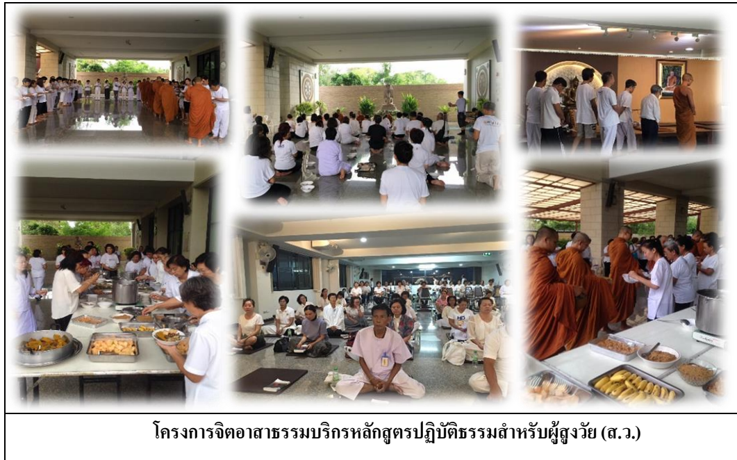
โครงการจิตอาสาธรรมบรืกรหลักสูตรปฏิบัติธรรมสำหรับผู้สูงวัย (ส.ว.)

โครงการ ส.ว. (จิตอาสาธรรมบรืกรหลักสูตรปฏิบัติธรรมสำหรับผู้สูงวัย) เป็นโครงการที่บริษัทฯ จัดกิจกรรมขึ้นเพื่อส่งเสริมให้พนักงานมีจิตอาสาในการทำประโยชน์ต่อสังคม ช่วยเหลือผู้สูงอายุ และร่วมปฏิบัติธรรมกับผู้สูงอายุร่วมกับมูลนิธิมาชาโคตมี กรุงเทพมหานคร โครงการนี้เริ่มขึ้นในเดือนกันยายน ปี 2554 ถึง ธันวาคม 2555 ในแต่ละเดือนจะผลัดเปลี่ยนหมุนเวียนพนักงานของแผนกต่างๆ ในการเป็นจิตอาสาหลักเข้าร่วมกิจกรรมนี้ และตั้งแต่ปี 2554 จนถึงปัจจุบัน ก็ยังเปิดโอกาสให้พนักงานเข้าร่วมเป็นจิตอาสาธรรมบรืกร และ เข้าร่วมปฏิบัติธรรมได้ตามความประสงค์ทุกเดือน