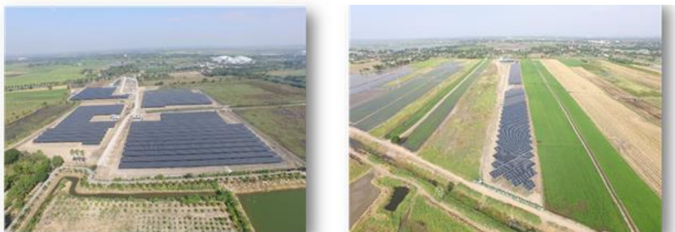
โครงการโซลาร์สหกรณ์วิเศษชัยชาญ จังหวัดอ่างทอง กำลังการผลิตติดตั้ง 5 เมกะวัตต์ และโครงการโซลาร์สหกรณ์พระนครศรีอยุธยา อำเภอพระนครศรีอยุธยา จังหวัดพระนครศรีอยุธยา กำลังการผลิตติดตั้ง 2 เมกะวัตต์

นอกจากการดำเนินการในเชิงธุรกิจแล้ว บริษัทฯ ยังมีนโยบายในการดำเนินงานที่สร้างมูลค่าเพิ่มให้กับองค์กรและสังคมในวงกว้าง ก่อให้เกิดการสร้างงาน สร้างรายได้ให้กับชุมชน ตามแนวทางการทำกิจการเพื่อสังคม โดยมีโครงการผลิตไฟฟ้าจากพลังงานแสงอาทิตย์แบบติดตั้งบนพื้นดินสำหรับหน่วยงานราชการและสหกรณ์ภาคการเกษตรเป็นโครงการต้นแบบ โดยนอกจากสมาชิกสหกรณ์จะได้รับผลตอบแทนที่ไม่ผันผวนเหมือนรายได้จากการเกษตรแล้ว ยังเป็นการสร้างความมั่นคงทางด้านพลังงานไฟฟ้าในพื้นที่โดยรอบและสร้างงานให้แก่สมาชิกและชุมชนในพื้นที่ สร้างกองทุนให้ความรู้ในการพัฒนาศักยภาพทางการเกษตรแก่สมาชิก รวมถึงโอกาสได้อาชีพเสริม อีกด้วย