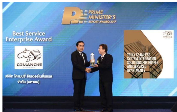
COMANCHE คว้ารางวัล "Prime Minister's Export Award 2017"

บริษัทฯ ตระหนักถึงการดำเนินธุรกิจที่สุจริตและเป็นธรรมตามกรอบกติกาการแข่งขัน ภายใต้กฎหมายและระเบียบข้อบังคับที่เกี่ยวข้อง จึงจัดให้มีระบบบริหารจัดการอย่างมีประสิทธิภาพ โปร่งใส สามารถตรวจสอบได้ ซึ่งจะช่วยสร้างความเชื่อมั่นและความมั่นใจต่อผู้ถือหุ้น ผู้ลงทุน ผู้มีส่วนได้เสียและผู้เกี่ยวข้องทุกฝ่าย เพื่อนำไปสู่การเจริญเติบโตอย่างยั่งยืนของธุรกิจ