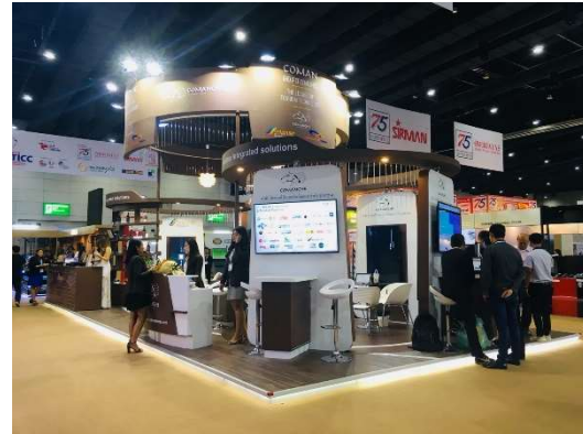
Food and Hotel Thailand 2018

และในวันที่ 5 – 8 กันยายน 2561 กลุ่มบริษัท โคแมนชี อินเตอร์เนชั่นแนล จำกัด (มหาชน) ได้ร่วมแสดงผลงานโชว์ศักยภาพการเป็นผู้พัฒนาเพื่อจำหน่าย ติดตั้ง และให้บริการซอฟต์แวร์หรือโปรแกรมสำเร็จรูปในงานฟู้ดแอนด์โฮเทลไทยแลนด์ 2018 (Food and Hotel Thailand 2018) ณ ศูนย์แสดงสินค้านานาชาติไบเทค บางนา กรุงเทพมหานคร สำหรับงานฟู้ดแอนด์โฮเทลไทยแลนด์ 2018 (Food and Hotel Thailand 2018) เป็นงานแสดงสินค้าอุตสาหกรรมอาหารและบริการ พรีเมียมระดับนานาชาติที่ใหญ่ที่สุดในประเทศไทย โดยได้รับการสนับสนุนการจัดงานจากภาครัฐและเอกชนในอุตสาหกรรมท่องเที่ยว อาหาร โรงแรม ทั้งไทยและต่างประเทศกว่า 25 องค์กร อาทิ การท่องเที่ยวแห่งประเทศไทย สมาคมโรงแรมไทย สมาคมร้านอาหาร สมาคมเชฟประเทศไทย ฯลฯ ทำให้การจัดงานมีความยิ่งใหญ่กว่าทุกครั้งที่ผ่านมา ซึ่งนอกจากจะมีการจัดแสดงสินค้าชั้นนำพรีเมียมระดับโลกแล้ว ยังมีการจัดแสดงนวัตกรรมเทคโนโลยีล่าสุดจากผู้ผลิตและบริษัทชั้นนำของโลก พร้อมกิจกรรมการประชุม สัมมนา การแข่งขันที่น่าสนใจมากมาย