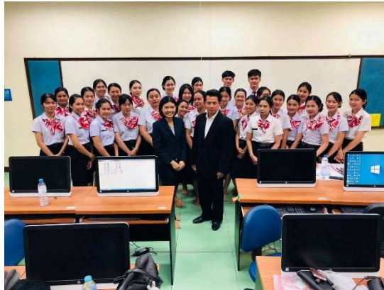
นักศึกษามหาวิทยาลัยอุบลราชธานี

อย่างไรก็ตาม ถึงแม้ว่าที่ผ่านมาการดำเนินธุรกิจของบริษัทจะไม่ได้สร้างผลกระทบต่อสังคมและสิ่งแวดล้อม แต่บริษัทก็ยังมุ่งมั่นสร้างสรรค์กิจกรรมที่ครอบคลุมถึงกิจกรรมเพื่อประโยชน์ต่อสังคมและอื่น ๆ (CSR After Process) อย่างสม่ำเสมอ ดังนี้