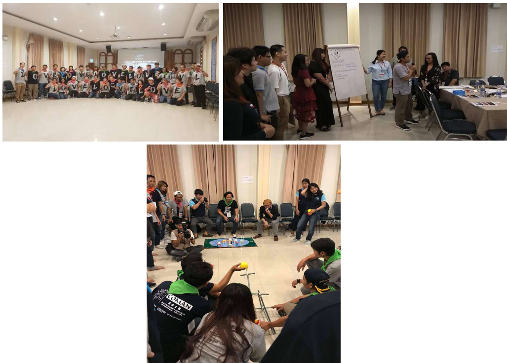
กิจกรรม Management Seminar 2018

แม้ปัจจุบันเป็นยุคของเทคโนโลยีดิจิทัล แต่สุดท้ายแล้วปัจจัยหนึ่งที่จะส่งผลต่อความสำเร็จของธุรกิจได้นั้นก็คือ ทรัพยากรบุคคลที่สามารถสร้างมูลค่าเพิ่มและเพิ่มผลผลิตได้ ดังนั้น บริษัทฯ จึงปรับปรุงสภาพแวดล้อมในการทำงานให้พนักงานมีคุณภาพชีวิตที่ดี และส่งเสริมให้พนักงานได้มีโอกาสแสดงศักยภาพ ตลอดจนได้รับโอกาสในการฝึกฝนและเพิ่มพูนทักษะการทำงาน