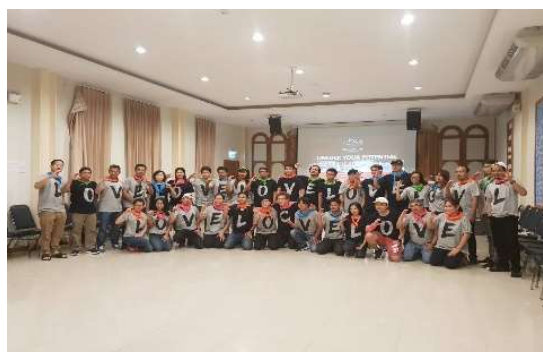
กิจกรรม Management Seminar 2018