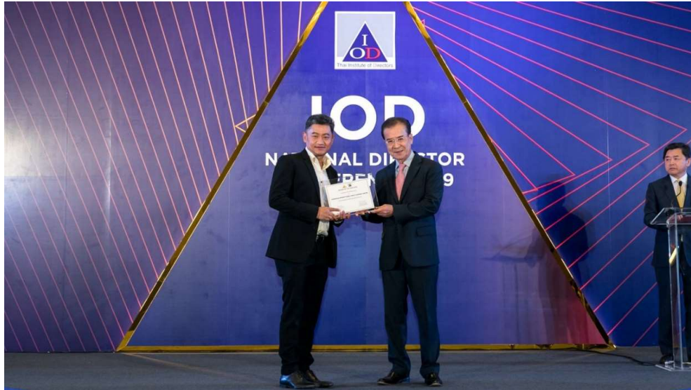
COMAN คว้รางวัล Special recognition ในงาน Board of the Year Awards