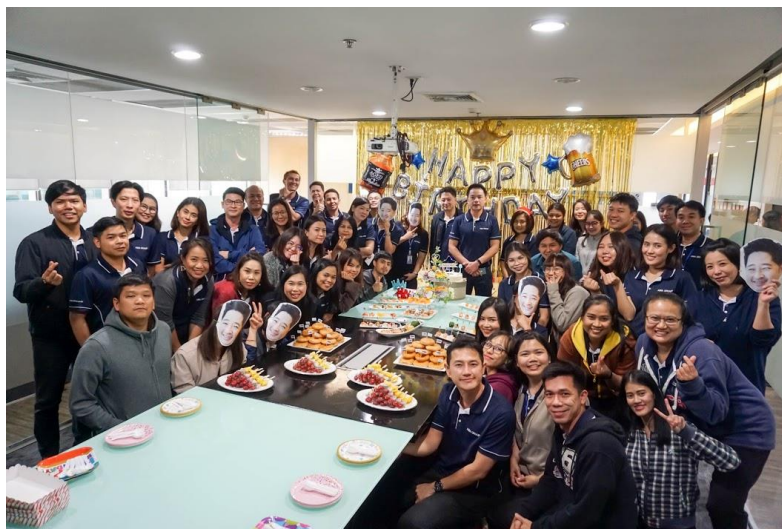
กิจกรรมวันเกิดพนักงาน

ในปี 2562 บริษัทได้จัดกิจกรรมตามเทศกาลต่างๆ อาทิเช่น กิจกรรมวันเกิดประจำเดือน งานเลี้ยงสังสรรค์ปีใหม่ งานสงกรานต์ งานทำบุญบริษัท และการจัดอบรมต่างๆ ให้พนักงานในองค์กร