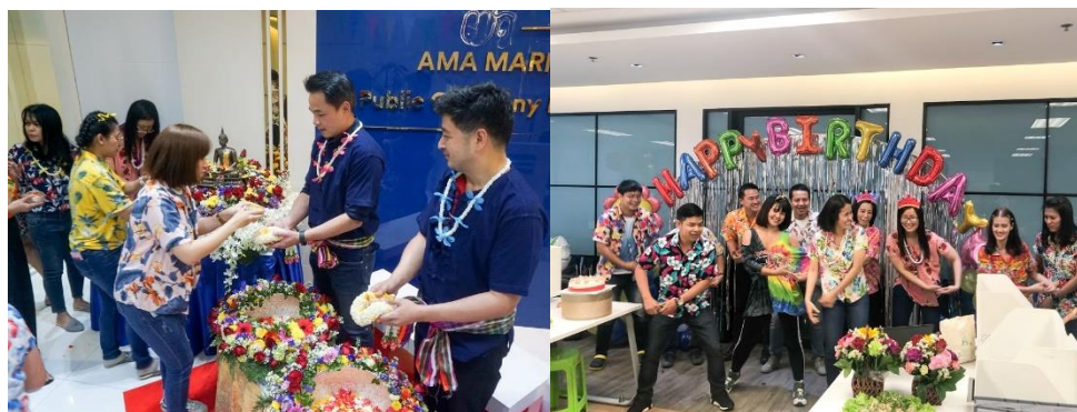
งานสงกรานต์