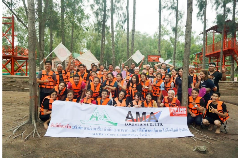
การอบรม SHIPS : Core Competency วัฒนธรรมองค์กร