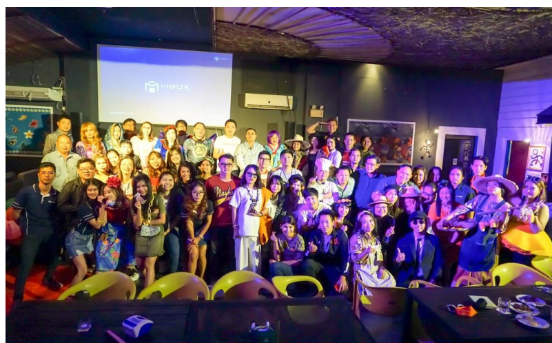
งานเลี้ยงสังสรรค์ปีใหม่