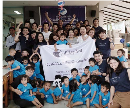
กิจกรรมเลี้ยงอาหารกลางวันและขนมให้กับเด็กที่มูลนิธิบ้านเด็กอ่อนเสียใจ (รัชดา)