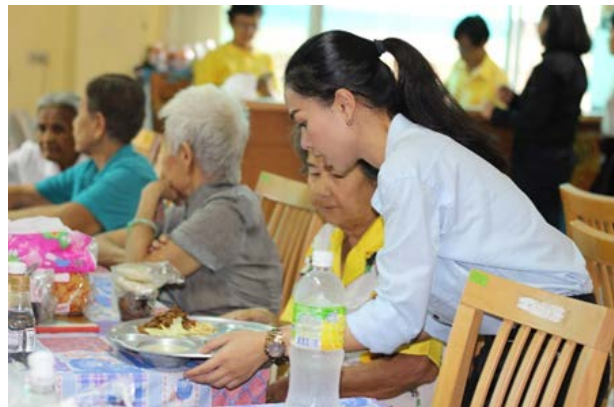
กิจกรรมเลี้ยงอาหารกลางวันและขนมแก่ผู้สูงอายุที่ศูนย์พัฒนาการจัดสวัสดิการสังคมผู้สูงอายุบ้านบางแค