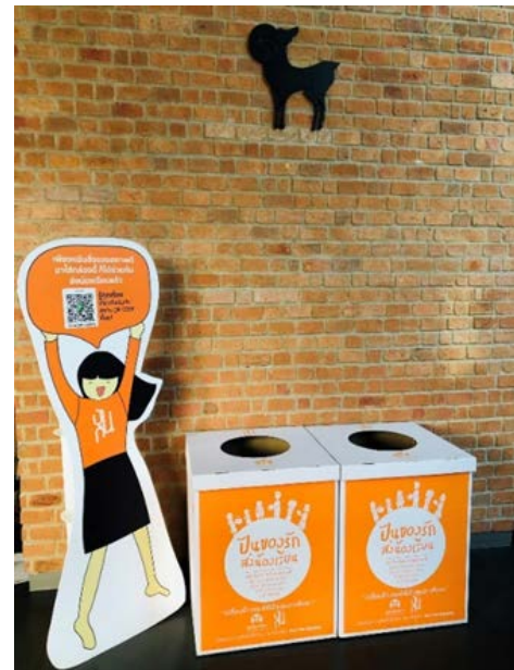
รับบริจาคสิ่งของเพื่อนำไปจำหน่ายในร้านปันกันเพื่อนำรายได้เป็นทุนการศึกษาให้เด็กในมูลนิธิยุวพัฒน์