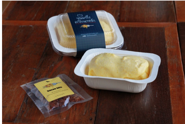
รายได้ส่วนหนึ่งจากการจำหน่าย “ขนมปังคาโบนาห์ล่า” มอบให้กับ โครงการเพื่อการศึกษา Limited Education

นอกจากนี้ บริษัทฯ ได้ร่วมลงนามบันทึกข้อตกลงความร่วมมือเพื่อการจัดการศึกษาด้านอาชีวศึกษา (MOU) ในการเข้าร่วมโครงการอาชีวศึกษาระบบทวิภาคีกับวิทยาลัยต่างๆ มากกว่า 10 แห่ง ซึ่งเป็นการเรียนในสถานศึกษาควบคู่ไปกับการทำงานจริงในสถานประกอบการ เน้นให้ผู้เรียนในสาขาวิชาชีพได้มีโอกาสฝึกงานภาคปฏิบัติในสถานประกอบการ เพื่อให้ผู้จบการศึกษาออกไปเป็นผู้ที่มีความรู้ ความสามารถในวิชาชีพนั้นๆ อย่างแท้จริงและมีคุณภาพตรงตามความต้องการของสถานประกอบการ