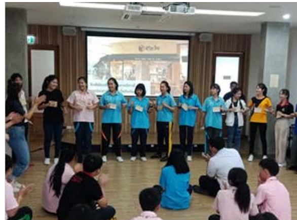
เข้าร่วมโครงการการศึกษาระบบทวิภาคี