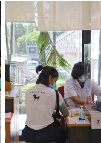
มอบขนมอบของบริษัทฯ ให้กับเด็กที่มูลนิธิบ้านนกขมิ้น กิจกรรมบริจาคโลหิตให้กับศูนย์บริการโลหิตแห่งชาติ สภากาชาดไทย

นอกจากนี้ บริษัทฯ ได้ร่วมลงนามบันทึกข้อตกลงความร่วมมือเพื่อการจัดการศึกษาด้านอาชีวศึกษา (MOU) ในการเข้าร่วมโครงการอาชีวศึกษาระบบทวิภาคีกับวิทยาลัยต่างๆ มากกว่า 10 แห่ง ซึ่งเป็นการเรียนในสถานศึกษาควบคู่ไปกับการทำงานจริงในสถานประกอบการ เน้นให้ผู้เรียนในสาขาวิชาชีพได้มีโอกาสฝึกงานภาคปฏิบัติในสถานประกอบการ เพื่อให้ผู้จบการศึกษาออกไปเป็นผู้ที่มีความรู้ ความสามารถในวิชาชีพนั้นๆ อย่างแท้จริงและมีคุณภาพตรงตามความต้องการของสถานประกอบการ