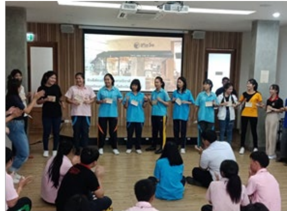
เข้าร่วมโครงการการศึกษาแบบทวิภาคี

บริษัทฯ สนับสนุนให้มีนวัตกรรมทั้งในระดับกระบวนการทำงานภายในองค์กร และในระดับความร่วมมือระหว่างองค์กร ซึ่งนวัตกรรมดังกล่าวหมายถึงการริเริ่มทำสิ่งต่างๆ ด้วยวิธีใหม่ๆ นอกจากนี้ ยังอาจหมายถึงการเปลี่ยนแปลงทางความคิด หรือการผลิต เพื่อเป็นการเพิ่มมูลค่าเพิ่มให้แก่ธุรกิจ เป้าหมายของนวัตกรรมคือการเปลี่ยนแปลงในเชิงบวก เพื่อให้สิ่งต่างๆ เกิดความเปลี่ยนแปลงไปในทางที่ดีขึ้น ก่อให้เกิดผลผลิตที่เพิ่มขึ้น ทั้งนี้ เพื่อให้เกิดประโยชน์ต่อสังคมอย่างสูงสุด โดยบริษัทฯ มีแนวทางในการปฏิบัติ ดังนี้