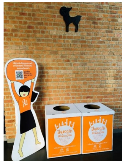
รับบริจาคสิ่งของเพื่อนำไปจำหน่ายในร้านปันกันเพื่อนำรายได้เป็นทุนการศึกษาให้เด็กในมูลนิธิยุวพัฒน์