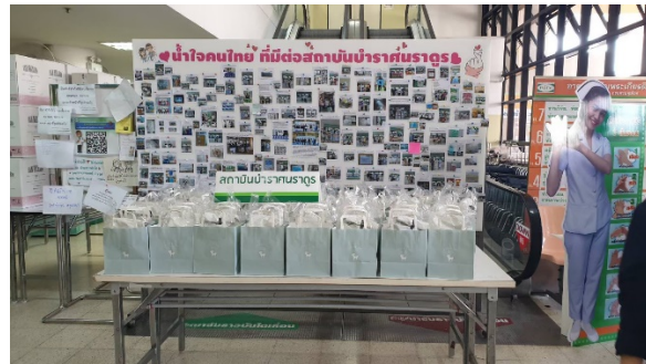
มอบขนมอบของบริษัทฯ ให้กับเจ้าหน้าที่ในหน่วยงานทางการแพทย์ต่างๆ ช่วงสถานการณ์โควิด