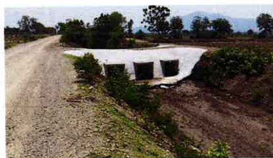
รูปที่ 2 และ 3. การก่อสร้างและซ่อมแซมฝายชะลอน้ำในบริเวณใกล้เคียงโครงการโรงไฟฟ้าพลังงานแสงอาทิตย์ของกลุ่มบริษัทฯ