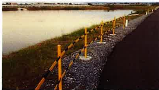
รูปที่ 1. บ่อพักน้ำภายในพื้นที่โครงการโรงไฟฟ้าพลังงานแสงอาทิตย์ของกลุ่มบริษัทฯ

กลุ่มบริษัทฯ ยึดถือนโยบายที่ต้องดูแลและสานสัมพันธ์กับชุมชนใกล้เคียง จึงสนับสนุนกิจกรรมของชุมชนอย่างสม่ำเสมอ โดยดำเนินโครงการต่างๆ ที่คำนึงถึงความเหมาะสมและประโยชน์ที่ชุมชนและสังคมจะพึงได้รับเพื่อการพัฒนาชุมชนอย่างยั่งยืน