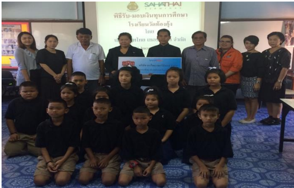
กิจกรรมมอบทุนการศึกษาแก่โรงเรียนวัดทองคั่ง

บริษัทฯ ตระหนักถึงการศึกษาของเยาวชนซึ่งจะเป็นกำลังสำคัญในการพัฒนาประเทศชาติ จึงมีกิจกรรมมอบทุนการศึกษาต่อเนื่องให้กับนักเรียนโรงเรียนวัดทองคั่ง โดยจัดมอบทุนการศึกษาเป็นประจำทุกปี เพื่อให้เด็กในชุมชนได้ศึกษาเล่าเรียนและเป็นความหวังของประเทศไทยในอนาคตต่อไป