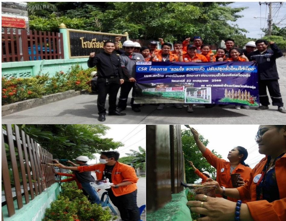
กิจกรรมซ่อมแซมรั้วโรงเรียนวัดทองคั่ง