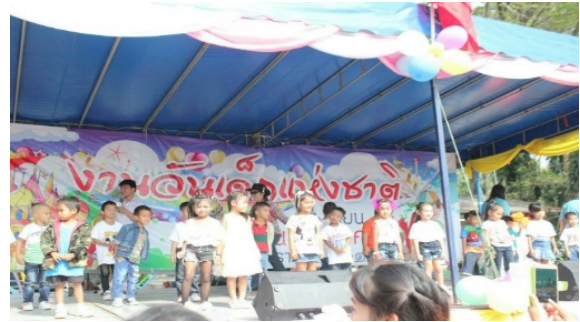
ร่วมบริจาคเงินเพื่อสนับสนุนในกิจกรรมวันเด็กแห่งชาติ ประจำปี 2561 โรงเรียนบ้านเขาบายศรี ต.พญาหลวง อ.สตึก จ.ชลบุรี