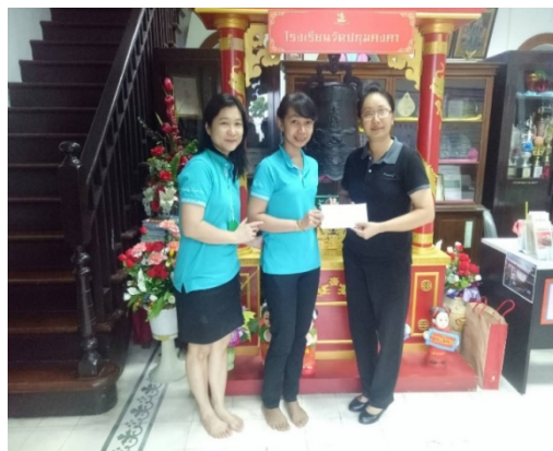
ร่วมบริจาคเงินเพื่อสนับสนุนในกิจกรรมวันเด็กแห่งชาติ ประจำปี 2561

การให้ความสำคัญด้านการศึกษาให้กับเยาวชนของชาติซึ่งจะเป็นกำลังสำคัญของประเทศในอนาคต บริษัทฯ จึงได้ตระหนักถึงความสำคัญของการส่งเสริมด้านการศึกษา ที่จะทำให้ประเทศมีศักยภาพในการพัฒนาต่าง ๆ ไม่ว่าจะเป็น ศักยภาพด้านเศรษฐกิจ การเงิน สังคม และวิทยาศาสตร์ ซึ่งล้วนเกิดจากการ ปลูกฝังความสำคัญ ความเข้าใจ ของการศึกษา รวมถึงทัศนคติที่ดีในวัยเด็ก โดยบริษัทฯ มีกิจกรรมบำเพ็ญประโยชน์ด้านการศึกษา ดังนี้