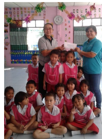
ร่วมบริจาคเงินสมทบทุนให้กับศูนย์พัฒนาเด็กเล็กเทศบาลฯ 3 (มหาวงษ์)

โรงเรียนวัดปทุมคงคา เขตสัมพันธวงศ์ กรุงเทพฯ