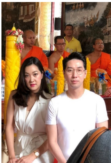
ร่วมกิจกรรมถวายเทียนในวันเข้าพรรษา ร่วมกับชุมชนวัดปทุมคงคา

บริษัทฯ เคารพต่อขนบธรรมเนียม ประเพณี และวัฒนธรรมแต่ละท้องถิ่นที่บริษัทฯ เข้าไปดำเนินธุรกิจ โดยดำเนินกิจกรรมเพื่อร่วมสร้างสรรค์สังคม ชุมชน และสิ่งแวดล้อม อย่างสม่ำเสมอ เพื่อให้ชุมชนที่บริษัทฯ ตั้งอยู่มีคุณภาพชีวิตที่ดีขึ้น ผ่านทางทั้งกิจกรรมที่ทางบริษัทฯ ดำเนินการเอง และการให้ความร่วมมือกับหน่วยงานของภาครัฐ ภาคเอกชน และชุมชน พร้อมทั้งให้ความร่วมมือในกิจกรรมต่างๆ กับชุมชนโดยรอบพื้นที่ที่บริษัทฯ เข้าไปดำเนินธุรกิจอยู่ตามควรแก่กรณี เช่น บริจาคเงินช่วยเหลือวัด การทำบุญที่มูลนิธิสงเคราะห์เด็กพญาด้วยการบริจาคสิ่งของจำเป็น การเป็นเจ้าภาพเลี้ยงอาหารมื้อเย็นให้กับเด็กกำพร้าและเด็กพิการ หรือผู้บริหารของบริษัทฯ ร่วมกิจกรรมถวายเทียนพรรษา ร่วมกับวัดปทุมคงคาวรวิหาร เป็นต้น