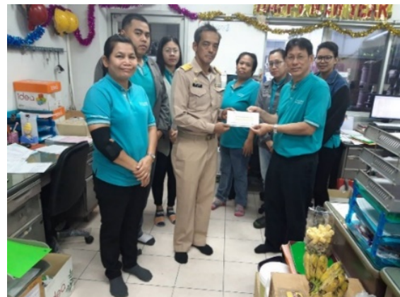
ร่วมบริจาคเงินสมทบทุนให้กับศูนย์พัฒนาเด็กเล็กเทศบาลฯ 3 (มหาวงษ์) เนื่องในกิจกรรมวันเด็กแห่งชาติประจำปี 2562