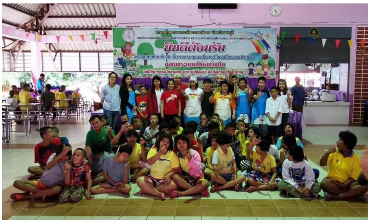
ร่วมบริจาคเงินและเลี้ยงอาหารเด็ก

บริษัทฯ เคารพต่อขนบธรรมเนียม ประเพณี และวัฒนธรรมแต่ละท้องถิ่น โดยดำเนินกิจกรรมเพื่อร่วมสร้างสรรค์สังคม ชุมชน และสิ่งแวดล้อม อย่างสม่ำเสมอ เพื่อให้ชุมชนที่มีคุณภาพชีวิตที่ดีขึ้น ผ่านทางทั้งกิจกรรมที่ทางบริษัทฯ ดำเนินการเอง และการให้ความร่วมมือกับหน่วยงานของภาครัฐ ภาคเอกชน และชุมชน พร้อมทั้งให้ความร่วมมือในกิจกรรมต่าง ๆ กับชุมชน เช่น ร่วมบริจาคเงินและเลี้ยงอาหารเด็ก ณ สถานสงเคราะห์เด็กพิการทางสมองและปัญญา จ.ราชบุรี เป็นต้น