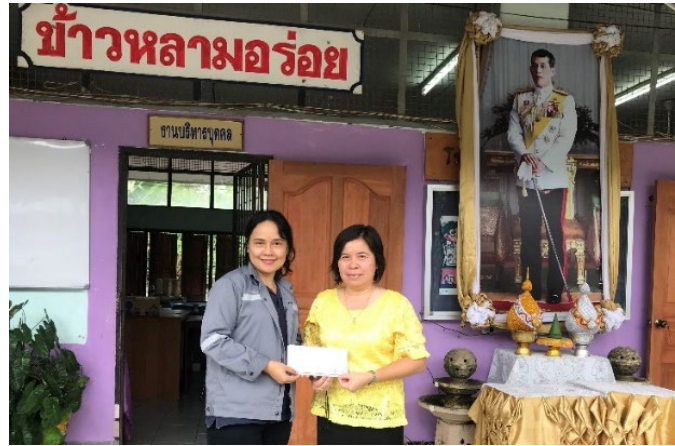
ร่วมบริจาคเงินเพื่อสนับสนุนในกิจกรรมวันเด็กแห่งชาติ ประจำปี 2562

โรงเรียนบ้านเขาบายศรี ต.พุดตาลอง อ.สตึก จ.บุรีรัมย์