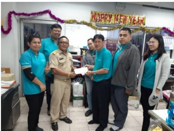
ร่วมบริจาคเงินสมทบทุนให้กับงานป้องกันและบรรเทาสาธารณภัย (ดับเพลิงสำโรงใต้) เนื่องในกิจกรรมวันเด็กแห่งชาติประจำปี 2562

การให้ความสำคัญด้านการศึกษากับเยาวชนของชาติซึ่งจะเป็นกำลังสำคัญของประเทศในอนาคต บริษัทฯ จึงได้ตระหนักถึงความสำคัญของการส่งเสริมด้านการศึกษา ที่จะทำให้ประเทศมีศักยภาพในการพัฒนาต่าง ๆ ไม่ว่าจะเป็น ศักยภาพด้านเศรษฐกิจ การเงิน สังคม และวิทยาศาสตร์ ซึ่งล้วนเกิดจากการปลูกฝังความสำคัญ ความเข้าใจ ของการศึกษา รวมถึงทัศนคติที่ดีในวัยเด็ก โดยบริษัทฯ มีกิจกรรมบำเพ็ญประโยชน์ด้านการศึกษา ดังนี้