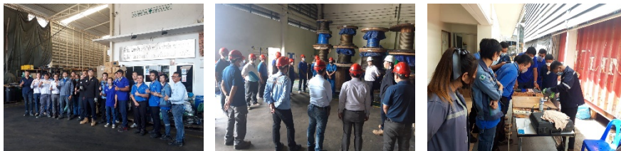
จัดอบรมให้ความรู้เกี่ยวกับการผลิต การไหลตเทสลดสลิ ให้กับทางวิศวกรรมสถานแห่งประเทศไทยในพระบรมราชูปถัมภ์ (วสท.) ณ คลังสำโรง คลัง D4 ของบริษัทฯ

การให้ความสำคัญด้านการศึกษากับเยาวชนของชาติซึ่งจะเป็นกำลังสำคัญของประเทศในอนาคต บริษัทฯ จึงได้ตระหนักถึงความสำคัญของการส่งเสริมด้านการศึกษา ที่จะทำให้ประเทศมีศักยภาพในการพัฒนาด้านต่าง ๆ ไม่ว่าจะเป็นศักยภาพด้านเศรษฐกิจ การเงิน สังคม และวิทยาศาสตร์ ซึ่งล้วนเกิดจากการ ปลูกฝังความสำคัญ ความเข้าใจ ของการศึกษา รวมถึงทัศนคติที่ดีในวัยเด็ก โดยบริษัทฯ มีกิจกรรมบำเพ็ญประโยชน์ด้านการศึกษา เช่น ร่วมบริจาคเงินสมทบทุนให้กับศูนย์พัฒนาเด็กเล็กเทศบาลฯ 3 (มหาวงษ์) เนื่องในกิจกรรมวันเด็กแห่งชาติประจำปี 2563 ร่วมบริจาคเงินเพื่อสนับสนุนในกิจกรรมวันเด็กแห่งชาติ ประจำปี 2563 โรงเรียนวัดปทุมคงคา และจัดอบรมให้ความรู้เกี่ยวกับการผลิต การไหลตเทสลดสลิให้กับทางวิศวกรรมสถานแห่งประเทศไทยในพระบรมราชูปถัมภ์ (วสท.) ณ คลังสำโรง คลัง D4 ของบริษัทฯ เป็นต้น