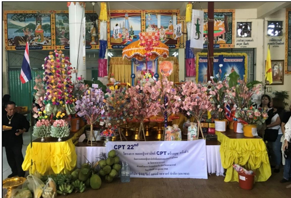
ภาพแสดง “โครงการ ทอดกฐินสามัคคี CPT สร้างบุญ ครั้งที่ 1”