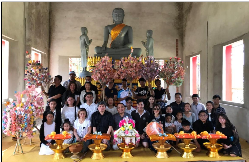
ภาพแสดง “โครงการ ทอดกฐินสามัคคี CPT สร้างบุญ ครั้งที่ 1”