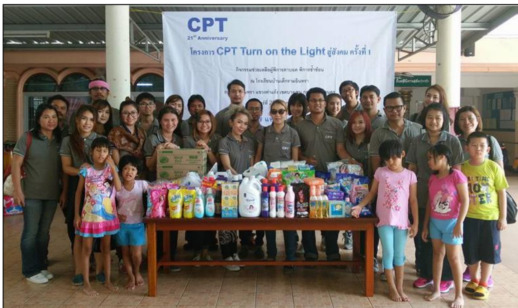
ภาพแสดง “โครงการ CPT Turn on the Light สู่อสงคม ครั้งที่ 1”

บริษัทมีนโยบายทำกิจกรรมเพื่อประโยชน์ต่อสังคมและสิ่งแวดล้อมเมื่อมีโอกาสที่เหมาะสม ซึ่งในปี 2559 บริษัทฯ ได้จัดกิจกรรม “โครงการ CPT Turn on the Light สู่อสงคม ครั้งที่ 1” เพื่อช่วยเหลือผู้พิการตาบอดและพิการซ้ำซ้อน ด้วยการบริจาคเงินและสิ่งของช่วยเหลือ โรงเรียนบ้านเด็กกรามอินทรา (บ้านเด็กตาบอดผู้พิการซ้ำซ้อน) ซึ่งสังกัดมูลนิธิธรรมมิกชนเพื่อคนตาบอดในประเทศไทย ในพระบรมราชูปถัมภ์ สาขากทม.นคร โดยกิจกรรมครั้งนี้ถือเป็นกิจกรรมตอบแทนสังคม CSR (Corporate Social Responsibility) ซึ่งถือว่าเป็น CSR after process พนักงานทุกคนได้มีส่วนร่วมร่วมกับบริษัทในการบริจาคเงินและสิ่งของ โดยปรากฏตามภาพดังนี้ :