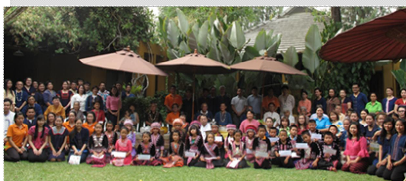
รูป : “การจัดกิจกรรม รดน้ำดำหัวผู้สูงอายุ มอบทุนการศึกษา และเครื่องอุปโภคบริโภค ให้คนในชุมชน เป็นต้น”