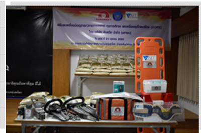
รูป : “การสนับสนุนด้านสาธารณสุข เช่น การบริจาคอุปกรณ์ทางการแพทย์ เป็นต้น”