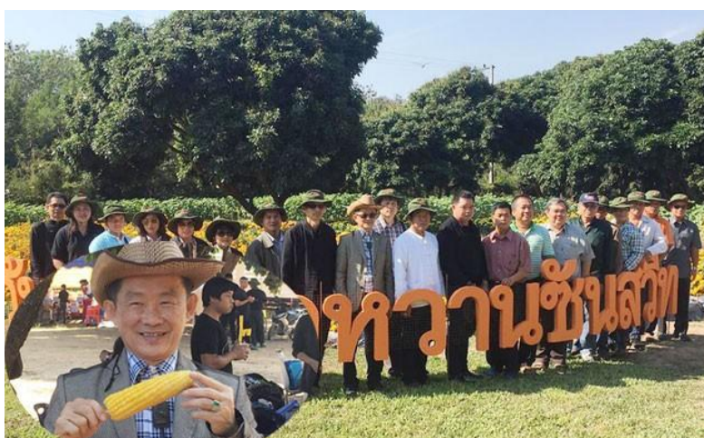
รูป : "วันงานข้าวโพดหวานชันสวีท"

นอกจากนี้ บริษัทยังมีการเน้นการถ่ายทอดความรู้เกี่ยวกับการดูแลสิ่งแวดล้อม เช่น การวางระบบบำบัดน้ำเสียที่ดี และการนำวัสดุคอกเหลือหรือของเสียจากกระบวนการผลิตกลับมาใช้เป็นแหล่งพลังงานในการผลิตพลังงานทดแทน เช่น ก๊าซชีวภาพ และเชื้อเพลิงชีวมวล