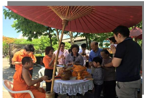
รูป : “กิจกรรมทางศาสนา เช่น การทำบุญวันเข้าพรรษา เป็นต้น”