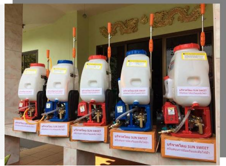
รูป : “การอนุรักษ์สิ่งแวดล้อม เช่น การปลูกต้นไม้ และการบริจาคอุปกรณ์ดับไฟฟ้า เป็นต้น”