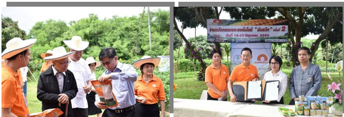
รูป : "ชันสวีทร่วมมืออำเภอแม่วาง สอนวิชาชีพปลูก 'ข้าวโพดหวาน' หนุนอาชีพเกษตรกร"

ตั้งแต่ปี 2559 บริษัทได้ริเริ่มให้มีการจัดงานนวัตกรรมและเทคโนโลยี ชันสวีท ทุกปี ณ ศูนย์เรียนรู้ KC Farm ของบริษัท โดยมีบริษัทและห้างร้านต่างๆ มาร่วมจัดกิจกรรมให้ความรู้ด้านนวัตกรรมและเทคโนโลยีการเกษตร แก่เกษตรกร นักเรียนนักศึกษา และผู้ที่สนใจในบริเวณใกล้เคียง ในงานนวัตกรรมและเทคโนโลยีการเกษตร ชันสวีท ประจำปี 2560 ได้มีการทำข้อตกลงความร่วมมือ (MOU) เรื่องหลักสูตรวิชาข้าวโพดหวาน ระหว่างศูนย์การศึกษานอกระบบและการศึกษาตามอัธยาศัยอำเภอแม่วางและบริษัท ซึ่งเป็นการสร้างและพัฒนาหลักสูตรการเรียนรู้อาชีพการเพาะปลูกข้าวโพดหวาน หลักสูตรดังกล่าวมีเป้าหมายเพื่อสร้างบุคลากรที่มีความรู้ ความสามารถและความเข้าใจในการปลูกข้าวโพดหวาน ซึ่งจะช่วยพัฒนาคุณภาพของบุคลากรในอุตสาหกรรมข้าวโพดหวานได้ในภาพรวม