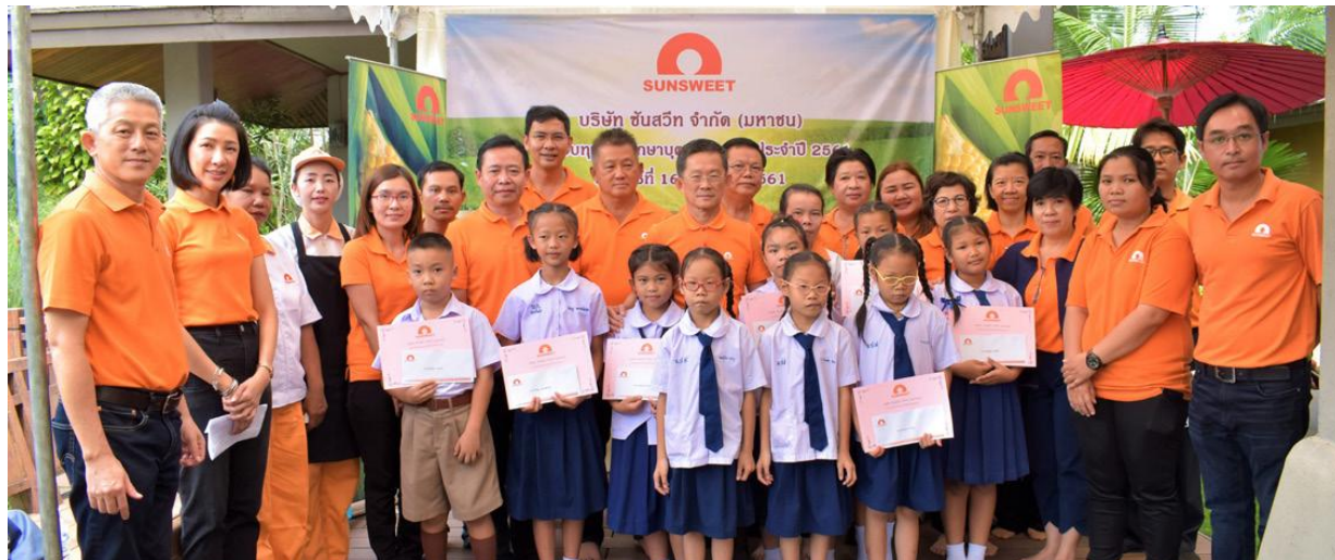
รูป : กิจกรรมสนับสนุนทางการศึกษา แก่บุตรพนักงาน

นอกจากนั้น บริษัทยังให้ความสำคัญในการมีส่วนร่วมและสร้างความสัมพันธ์อันดีให้เกิดขึ้นระหว่างบริษัทกับชุมชนและสังคมเพื่อส่งเสริมกิจกรรมด้านต่าง ๆ ที่เป็นประโยชน์ในการพัฒนาสังคมและชุมชน ตลอดจนการจัดกิจกรรมเพื่อบำเพ็ญสาธารณประโยชน์ต่อสังคมในทุกๆ ปี โดยมีวัตถุประสงค์หลักที่จะให้พนักงานทุกคนมีจิตสำนึกต่อการพัฒนาสังคมได้แก่