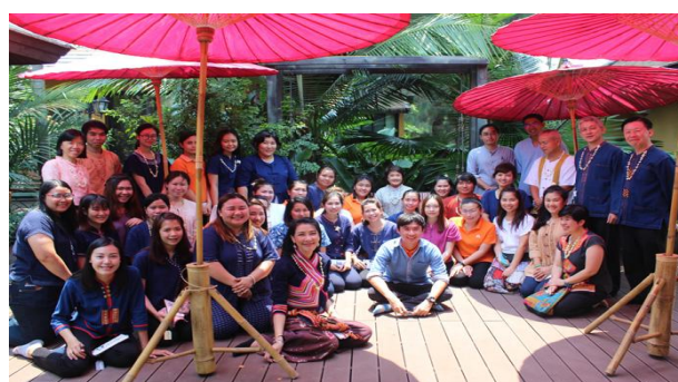
รูป : การจัดกิจกรรม รดน้ำดำหัวผู้สูงอายุ มอบทุนการศึกษา และเครื่องอุปโภคบริโภค ให้คนในชุมชน เป็นต้น