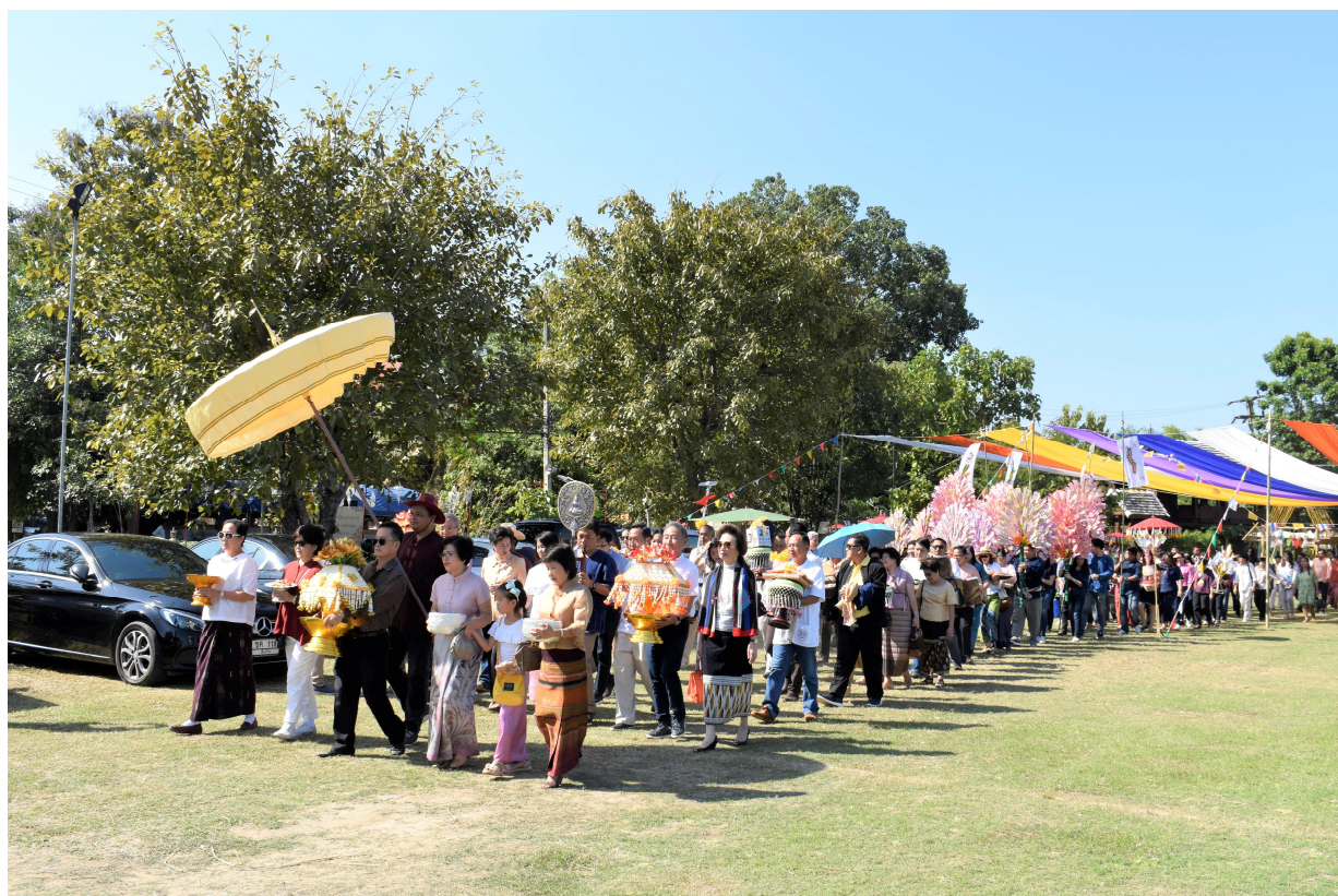
รูป : "กิจกรรมทางศาสนา เช่น การทำบุญวันเข้าพรรษา ทอดกฐิน เป็นต้น"