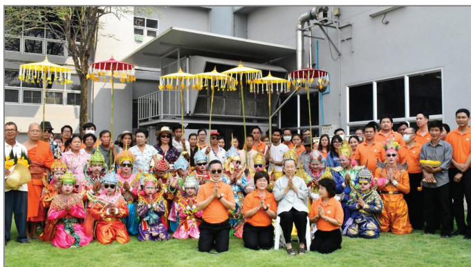
รูป : กิจกรรมทางศาสนา เช่น บวชลูกแก้ว ใส่บาตร