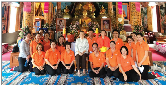
รูป : กิจกรรมทางศาสนา เช่น การทำบุญวันเข้าพรรษา เป็นต้น