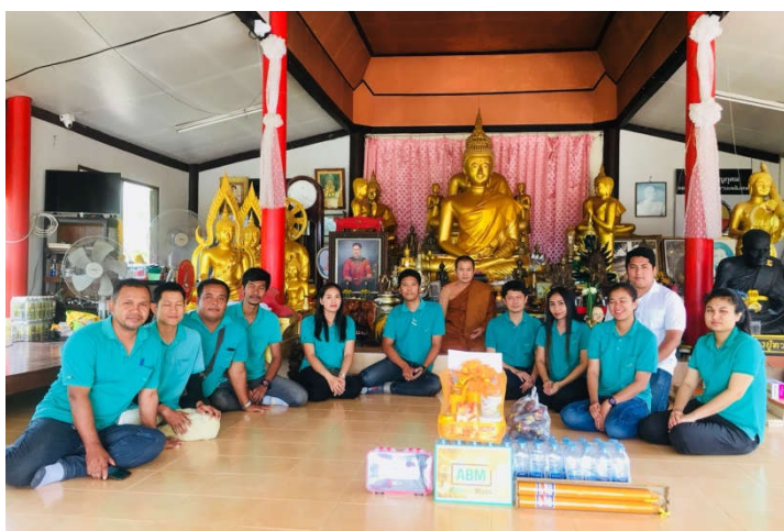
ในวันที่ 25 กรกฎาคม 2561 ณ วัดนทีคมเขต จ.สุราษฎร์ธานี