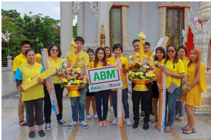
ในวันที่ 23 กรกฎาคม 2561 ณ วัดสะแกงาม กรุงเทพมหานคร