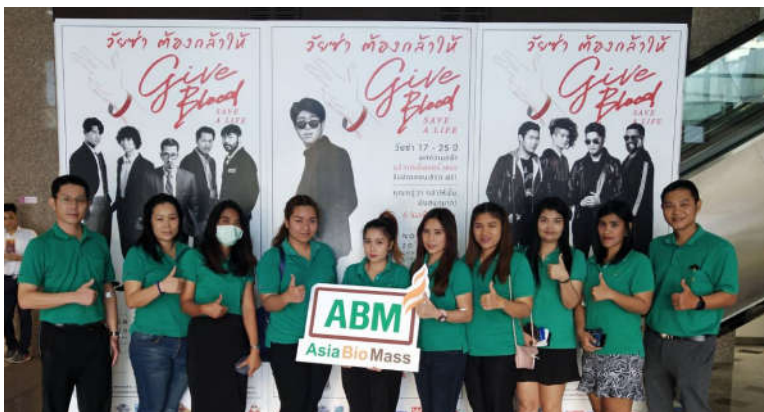
ครั้งที่ 2 ในวันที่ 29 ตุลาคม 2561

กรกฎาคม 2561 บริษัทฯ ได้ตระหนักและเล็งเห็นถึงความสำคัญของการอนุรักษ์และสืบสานประเพณีที่ดีงาม จึงได้ทำโครงการแห่เทียนพรรษาและผ้าอาบน้ำฝน ซึ่งพนักงานจะได้มีส่วนร่วมในการทำบุญและสืบสานประเพณีที่ดีงามของไทย รวมทั้งเป็นการเสริมสร้างความรัก ความสามัคคี ความร่วมมือ ความสนุกสนานและผูกมิตรไมตรีที่ดีต่อกัน ตลอดจนเป็นการอนุรักษ์และสืบทอดประเพณีที่ดีงามให้คงอยู่ต่อไป