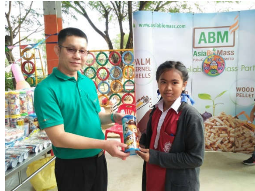
โรงเรียนบ้านบางน้ำจืด จ.สมุทรสาคร