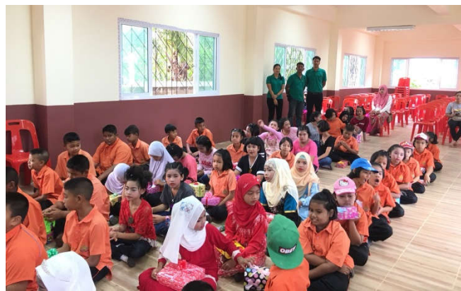
โรงเรียนบ้านสันติสุข จ.สุราษฎร์ธานี