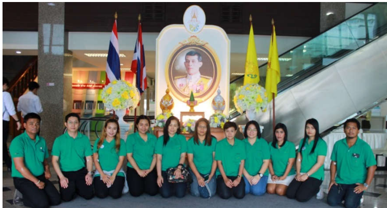
ครั้งที่ 1 ในวันที่ 19 กรกฎาคม 2561

กรกฎาคม 2561 บริษัทฯ ได้จัดทำโครงการ “จิตอาสา เราทำความดี บริจาคโลหิต ด้วยหัวใจ” เพื่อถวายเป็นพระราชกุศล เนื่องในวันเฉลิมพระชนมพรรษา 66 พรรษา สมเด็จพระเจ้าอยู่หัวมหาวชิราลงกรณ บดินทรเทพยวรางกูร รวมทั้งเพื่อเป็นการสร้างจิตสำนึกในการช่วยเหลือชีวิตและเพื่อให้มีโลหิตเพียงพอต่อความต้องการ ณ ศูนย์บริการโลหิตแห่งชาติ สภากาชาดไทย ครั้งที่ 1 ในวันที่ 19 กรกฎาคม 2561 และครั้งที่ 2 โครงการ “จิตอาสา บริจาคโลหิต ด้วยหัวใจ หนึ่งคนให้ สามคนรับ” ในวันที่ 29 ตุลาคม 2561