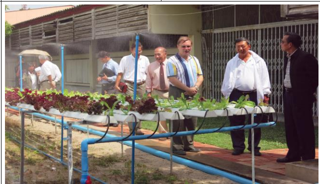
โครงการเกษตรเพื่อส่งเสริมอาชีพนักเรียน โรงเรียนบ้านนา "นายกพิทยากร"