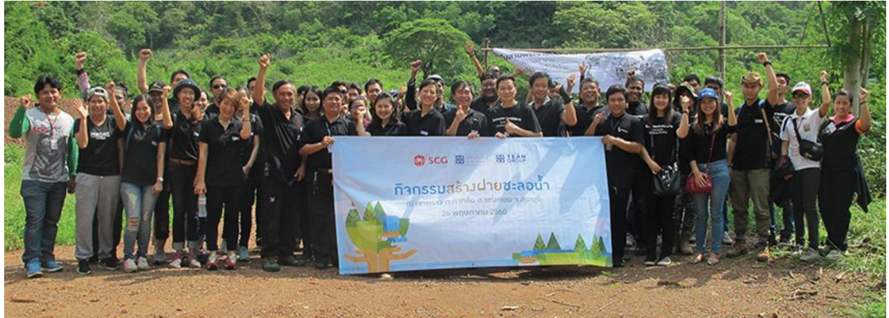
สร้างฝายชะลอน้ำ

กิจกรรมส่งเสริมอาชีพเยาวชน เพื่อส่งเสริมอาชีพให้แก่น้องๆ นักเรียน พร้อมมอบอุปกรณ์ตั้งต้นการปลูกผักไฮโดรโปนิิกส์และแก่นตะวัน และจัดบรรยายพิเศษโดยวิทยากรผู้มีประสบการณ์มาให้ความรู้และร่วมแบ่งปันประสบการณ์