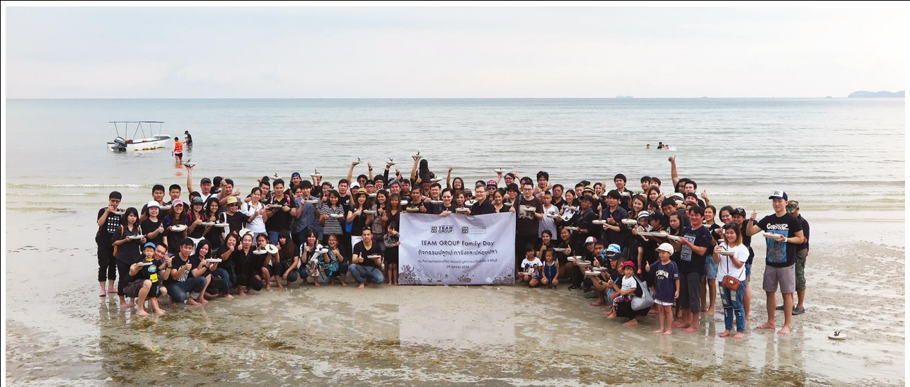
ปลูกปะการัง

กิจกรรมอนุรักษ์สิ่งแวดล้อม เพื่อการมีส่วนร่วมในการอนุรักษ์ธรรมชาติและสิ่งแวดล้อม และสร้างความสามัคคีให้แก่พนักงานในองค์กร