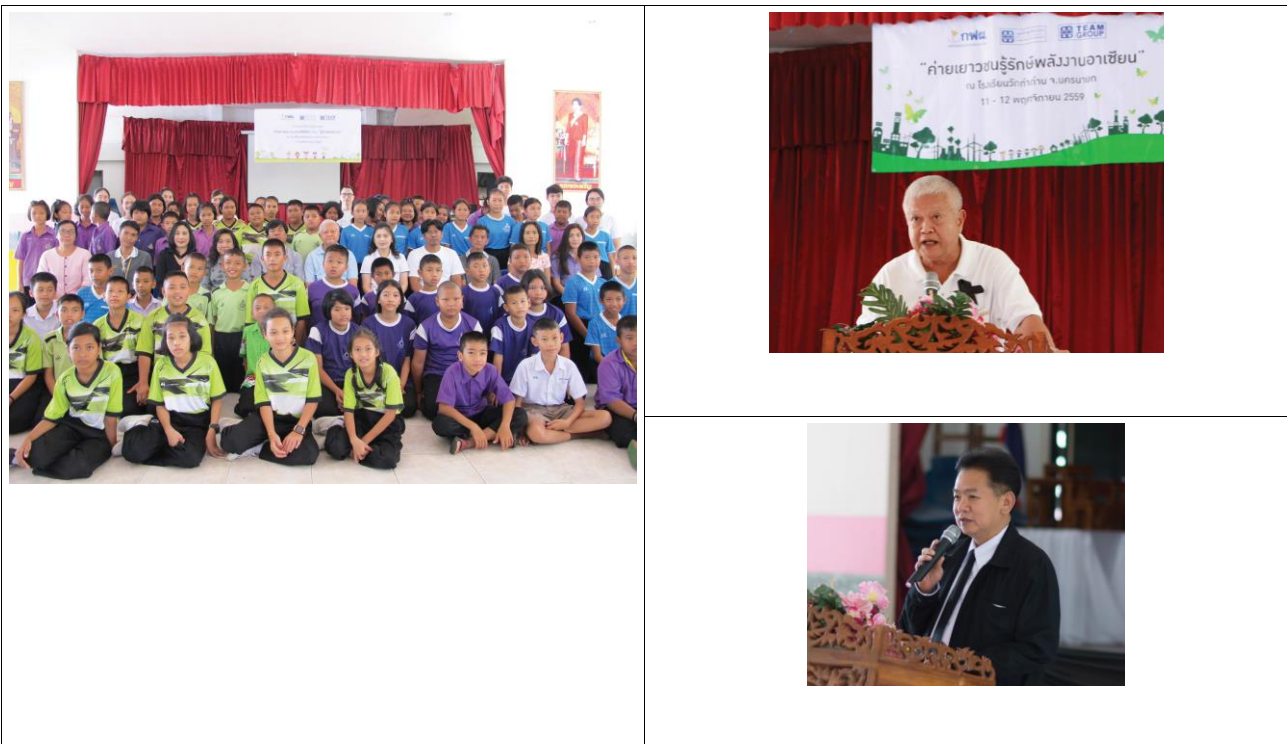
ค่ายเยาวชนอนุรักษ์พลังงานอาเซียน ให้ความรู้เยาวชน "WTEAM Kids" สานต่อที่พ่อทำ

ส่งต่อความรู้จากมืออาชีพสู่สาธารณะ การสัมมนาเชิงสาธารณะ (Public Seminar) เป็นการนำประเด็นที่ทีมกรุ๊ปมีความเชี่ยวชาญและกำลังเป็นที่สนใจของสังคมในขณะนั้นมาเป็นหัวข้อสัมมนา เพื่อให้ความรู้ในเชิงวิชาการแลกเปลี่ยนประสบการณ์ รวมทั้งการหาข้อสรุปในประเด็นคำถามร่วมกัน และร่วมบรรยายความรู้กับองค์กรภายนอก เพื่อสร้างความรู้ความเข้าใจ รวมทั้งแลกเปลี่ยนความรู้เพื่อสร้างความเจริญมั่นคงให้แก่สังคม