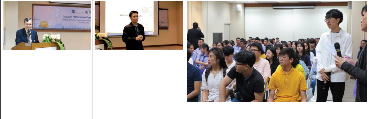
โครงการศึกษาแหล่งเรียนรู้ “มั่งสู่วิริยะ”