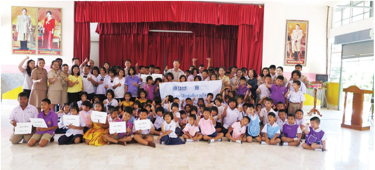
มอบทุน 5 โรงเรียนใน จ.นครสวรรค์