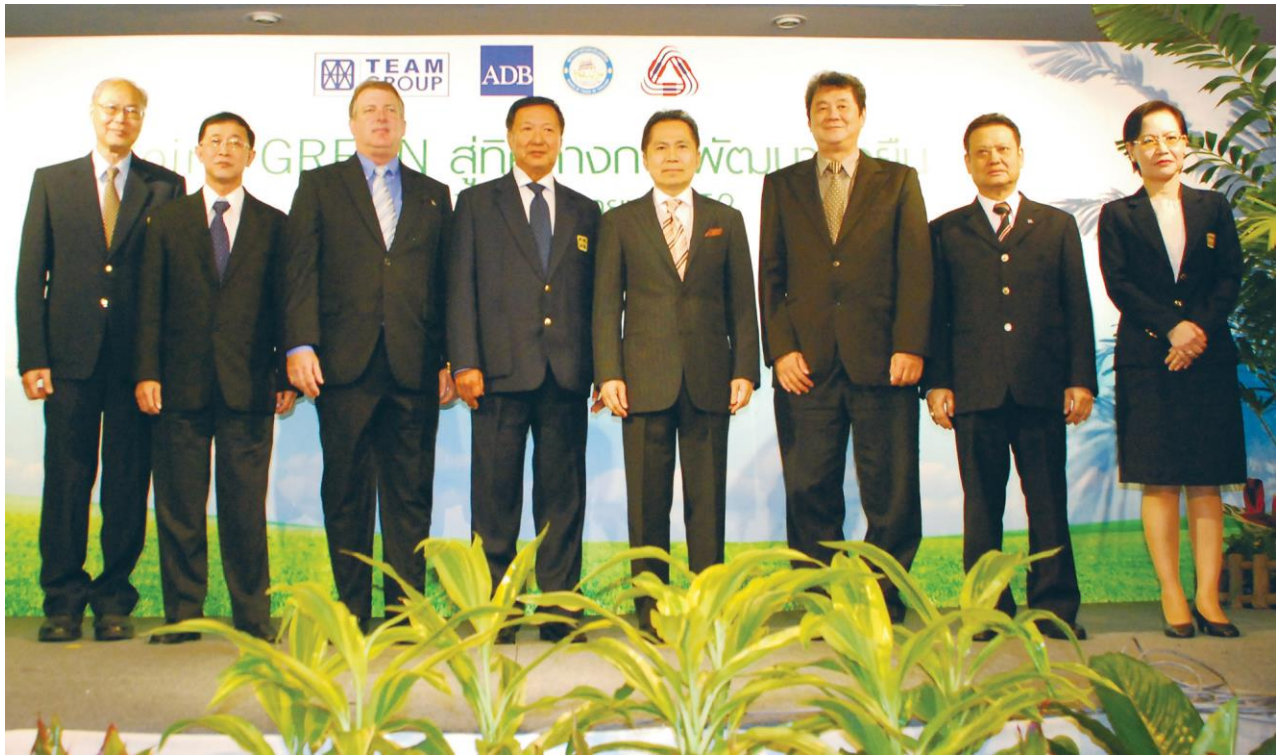
Going Green สู่การพัฒนาที่ยั่งยืน