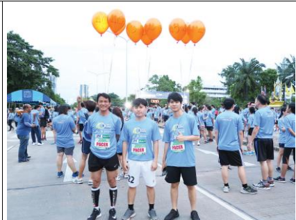
เดิน-วิ่งการกุศล