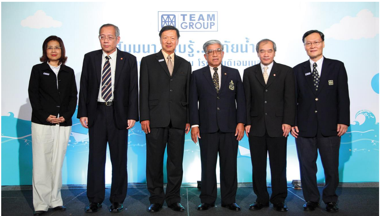
ความพร้อมในการรับมือภัยน้ำ 2555