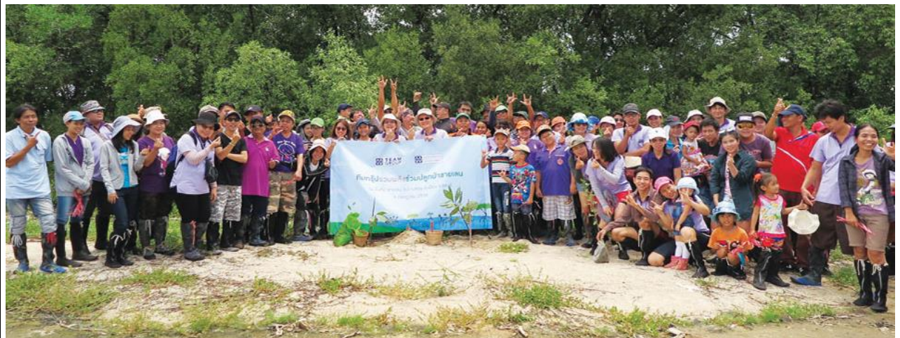
ปลูกป่าชายเลน