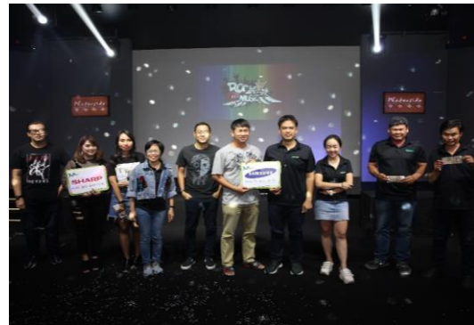
อบรมความรู้เรื่องสิทธิประกันสังคมและเล่นเกมส์ ปี 2018