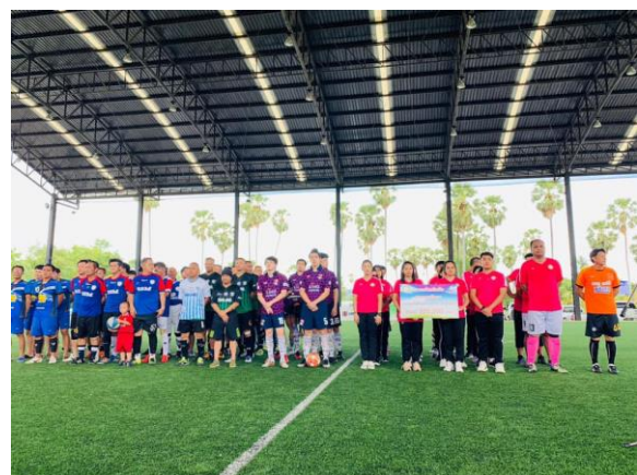
รูปภาพกิจกรรม การแข่งขันฟุตบอลรา นักพิเศษ สนับสนุนกิจกรรมเพื่อพัฒนาการศึกษา ศูนย์ส่งเสริมทักษะชีวิตบุคคลออทิสติก จังหวัดชลบุรี วันที่ 20 กรกฎาคม 2562