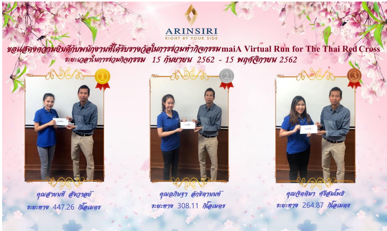
รูปภาพกิจกรรม maiA Virtual Run for สภากาชาดไทย