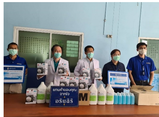
รูปภาพกิจกรรม การร่วมบริจาคหน้ากากอนามัย แอลกอฮอล์ฆ่าเชื้อและสบู่เหลวล้างมือ เพื่อสนับสนุนการปฏิบัติงานของบุคลากรทางการแพทย์ วันเสาร์ที่ 8 เมษายน 2563