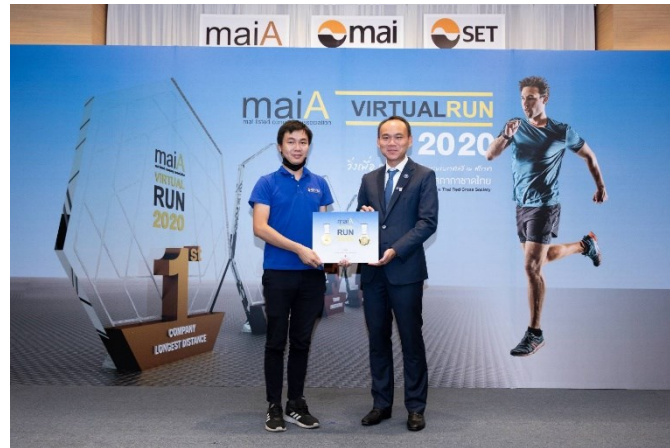
รูปภาพกิจกรรม maiA Virtual Run for สภากาชาดไทย

ทั้งนี้ทางผู้บริหารระดับสูงได้มอบรางวัลให้กับพนักงาน 3 อันดับแรกที่ทำระยะทางได้ดีที่สุดในการร่วมกิจกรรมครั้งนี้ ทางบริษัทได้รับความร่วมมือในการทำกิจกรรมเป็นอย่างดี และเป็นการจูงใจให้พนักงานตระหนักถึงการรักษาสภาพร่างกายให้แข็งแรงอีกด้วย