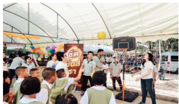
โครงการโลกนิทานของหนู แห่งที่ 11 ณ โรงเรียนบ้านบางกง จังหวัดสระบุรี (วันอาทิตย์ที่ 20 พฤษภาคม 2561)