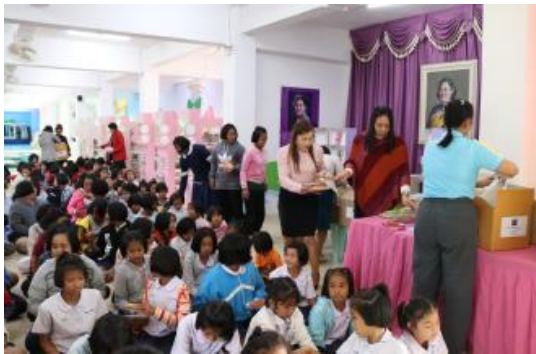
โรงเรียนบ้านหนองปรู จังหวัดนครราชสีมา (26 ธันวาคม 2560)

นอกจากการจัดสร้างห้องสมุด บริษัทยังมีการแจกขนมเด็กในโครงการโลกนิทานของหนูเป็นประจำ