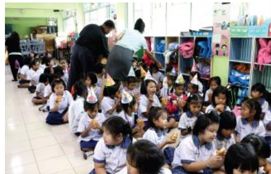
โรงเรียนบ้านหนองปรู จังหวัดนครราชสีมา (21 พฤษภาคม 2560)