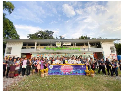
โครงการโลกนิทานของหนู แห่งที่ 12

ณ โรงเรียนบ้านพุ่ม จังหวัดขอนแก่น (วันเสาร์ที่ 26 ตุลาคม 2562)