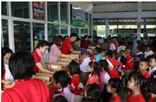
โรงเรียนชุมชนวัดใหญ่โพหัก จังหวัดราชบุรี (28 ธันวาคม 2560)