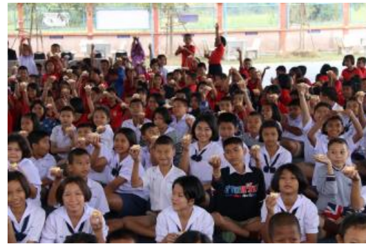
โรงเรียนบ้านบางกง จังหวัดสระบุรี (26 ธันวาคม 2560)