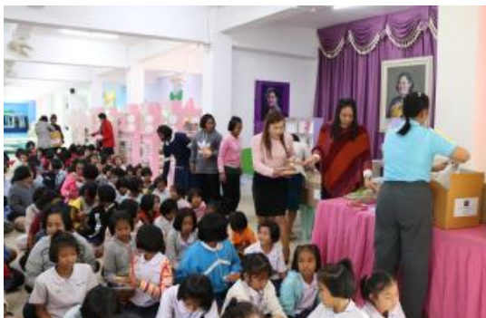
โรงเรียนบ้านหนองปรู จังหวัดนครราชสีมา (26 ธันวาคม 2560)

นอกจากการจัดสร้างห้องสมุด บริษัทยังมีการแจกขนมเด็กในโครงการโลกนิทานของหนูเป็นประจำ