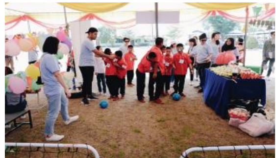
โครงการโลกนิทานของหนู แห่งที่ 10 ณ โรงเรียนบ้านหนองปรู จังหวัดนครราชสีมา (วันอาทิตย์ที่ 21 พฤษภาคม 2560)