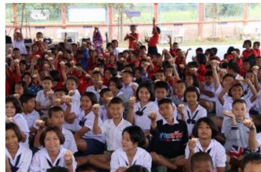
โรงเรียนบ้านบางกง จังหวัดสระบุรี (26 ธันวาคม 2560)