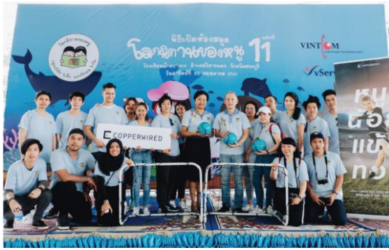
โครงการโลกนิทานของหนู แห่งที่ 11 ณ โรงเรียนบ้านบางกง จังหวัดสระบุรี (วันอาทิตย์ที่ 20 พฤษภาคม 2561)