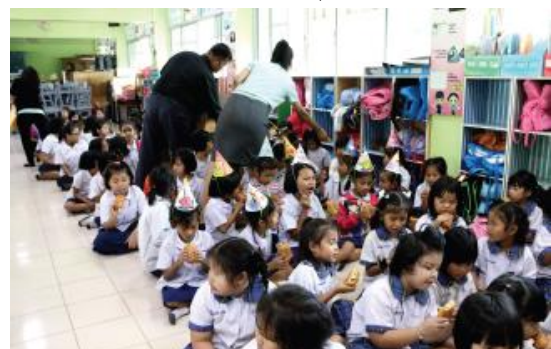
โรงเรียนบ้านหนองปรู จังหวัดนครราชสีมา (21 พฤษภาคม 2560)