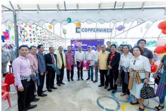
โครงการโลกนิทานของหนู แห่งที่ 12 ณ โรงเรียนบ้านพุ่ม จังหวัดขอนแก่น (วันเสาร์ที่ 26 ตุลาคม 2562)