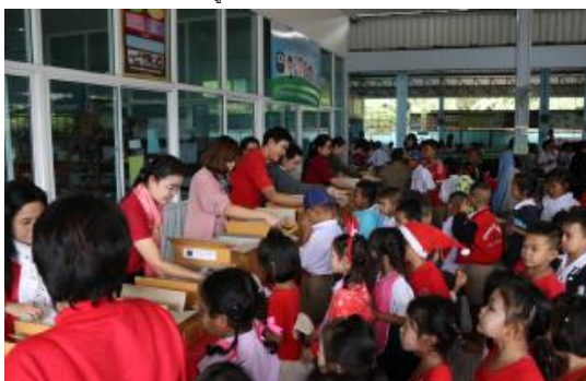
โรงเรียนชุมชนวัดใหญ่โพหัก จังหวัดราชบุรี (28 ธันวาคม 2560)