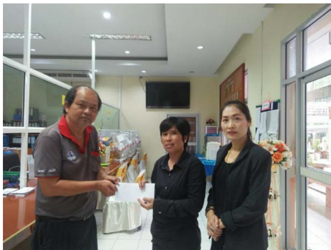
รูปภาพบริษัทฯ มอบทุนการศึกษา