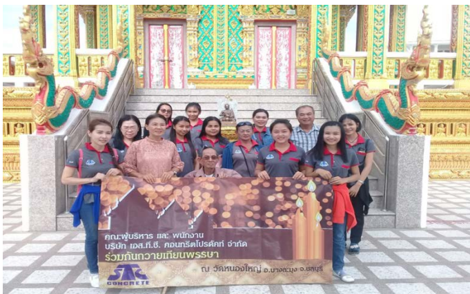
รูปภาพบริษัทฯ ถวายเทียนพรรษา