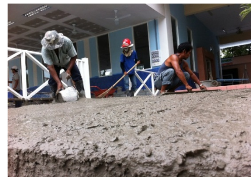
รูปภาพบริษัทฯ อนุเคราะห์คอนกรีตผสมเสร็จ