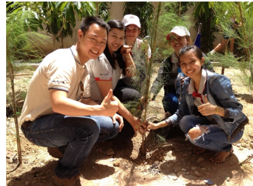
รูปภาพบริษัทฯ ร่วมปลูกต้นไม้