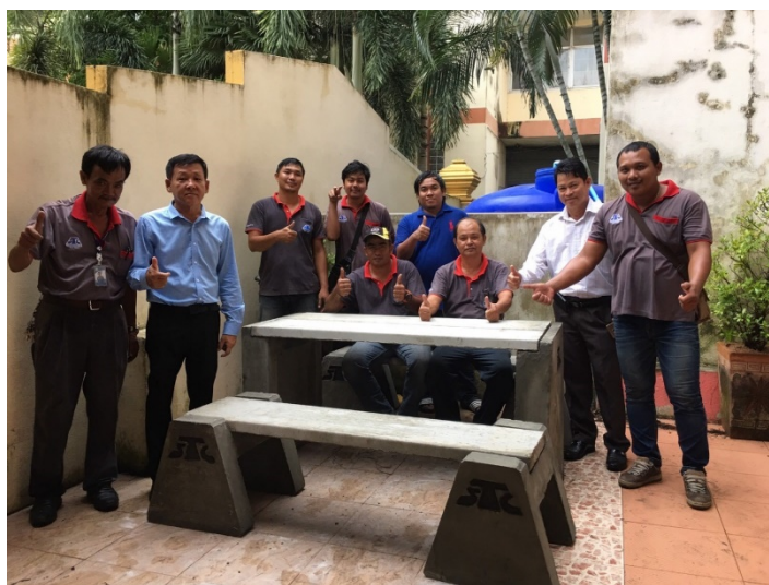
รูปภาพบริษัทฯ มอบเก้าอี้ โต๊ะนั่งเล่น