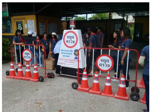
รูปภาพบริษัทฯ ร่วมกันมอบป้ายกันจราจรและกรวย