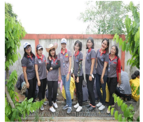
รูปภาพบริษัทฯ ร่วมกันปลูกต้นไม้รอบโรงเรียนเมือง 11