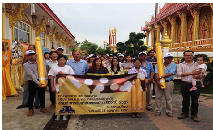
รูปภาพบริษัทฯ ถวายเทียนพรรษา