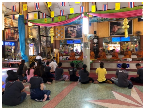
รูปภาพบริษัทฯ ร่วมกันเวียนเทียน และถวายเทียนพรรษา