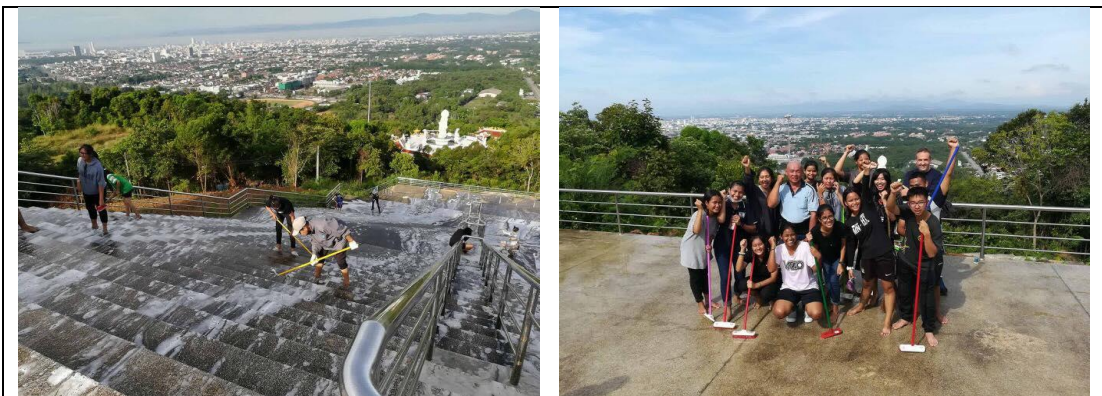
โครงการจิตอาสาพัฒนาภูมิทัศน์

บริษัทฯ ร่วมสนับสนุนอุปกรณ์และผลิตภัณฑ์ทำความสะอาดแก่จิตอาสา ในโครงการจิตอาสาพัฒนาภูมิทัศน์ เพื่อฟื้นฟูภูมิทัศน์สถานที่ศักดิ์สิทธิ์และสถานที่ท่องเที่ยวของหาดใหญ่ ณ ชัยบันไดหน้าพระพุทธรูปมณฑลมหาธาตุนว น สวรรณะบน เขาอโศก หาดใหญ่