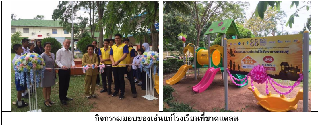
กิจกรรมมอบของเล่นแก่โรงเรียนที่ขาดแคลน

บริษัทฯ ร่วมกับผู้ผลิตและผู้จำหน่ายสินค้าจัดกิจกรรมมอบของเล่นแก่โรงเรียนที่ขาดแคลน เพื่อสนับสนุนของเล่นแก่เด็กนักเรียนในโรงเรียนให้มีโอกาสเล่นของเล่นเสริมทักษะ การเรียนรู้ เหมือนนักเรียนในตัวเมือง โครงการนี้จัดขึ้นปีละ 1-2 ครั้ง