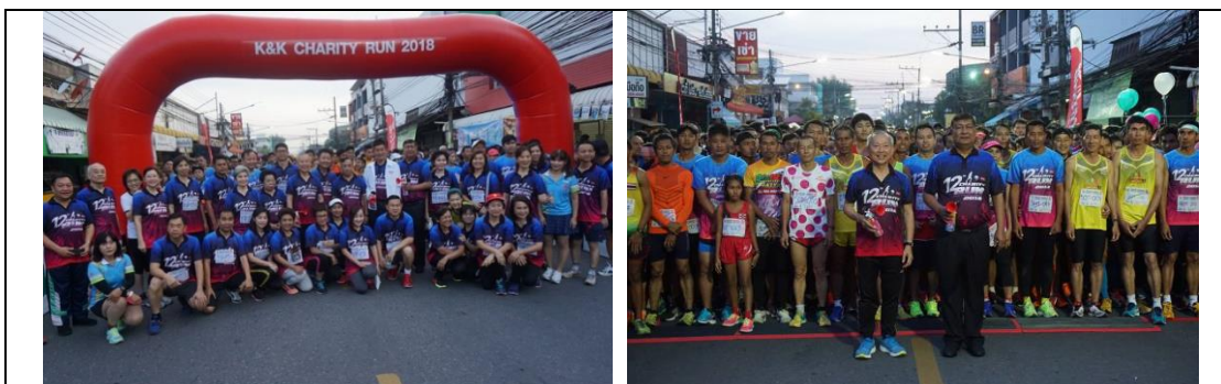
กิจกรรม K&K เดิน-วิ่งการกุศล

บริษัทฯ จัดกิจกรรม K&K เดิน-วิ่งการกุศล ขึ้นทุกปี โดยในปี 2562 เป็นปีที่ 13 โดยมีวัตถุประสงค์หลักเพื่อบริจาคเงินให้แก่ มูลนิธิ และโรงพยาบาล และเพื่อส่งเสริมสุขภาพแก่ประชาชนและพนักงานของบริษัทฯ