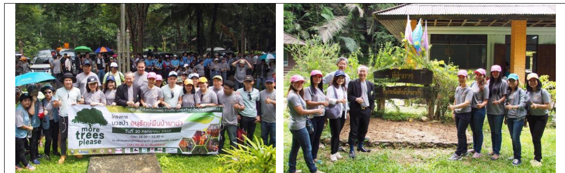
กิจกรรมบวชป่า อนุรักษ์ผืนป่าผาดำ

บริษัทฯ ร่วมกับการค้าจังหวัดสงขลา และสมาคมต่างๆ ร่วมกันบวชป่าผาดำ เพื่ออนุรักษ์ผืนป่า ในพื้นที่จังหวัดสงขลา ณ เขตอนุรักษ์ผืนป่าผาดำ อ.คลองหอยโข่ง จ.สงขลา ในวันที่ 30 กรกฎาคม 2560