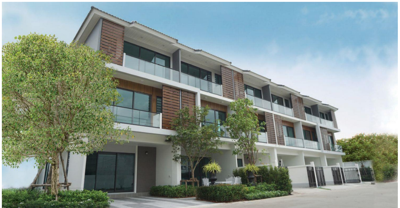
ภาพบ้านในโครงการ Supalai Urbana บางนา-วงแหวน