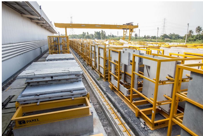
ภาพสินค้าของบริษัท