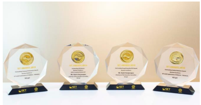
SET Awards 2019: ผู้บริหารสูงสุดดีเด่น ผู้บริหารสูงสุดรุ่นใหม่ดีเด่น บริษัทที่มีผลการดำเนินงานดีเด่น และนักลงทุนสัมพันธ์ดีเด่น

VGI เป็นบริษัทในกลุ่มสื่อและสิ่งพิมพ์บริษัทเดียว ที่เข้าเป็นสมาชิกของดัชนี SET50