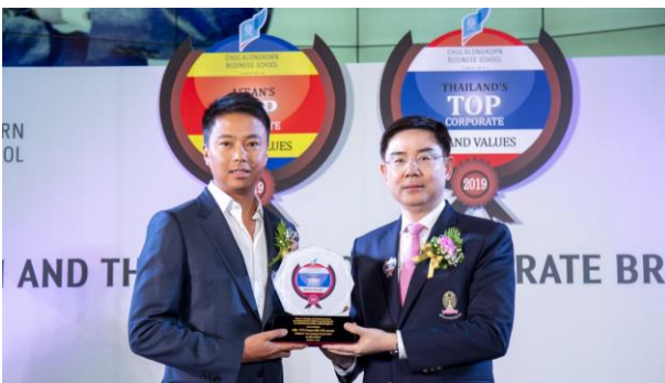
Top Corporate Brands Awards