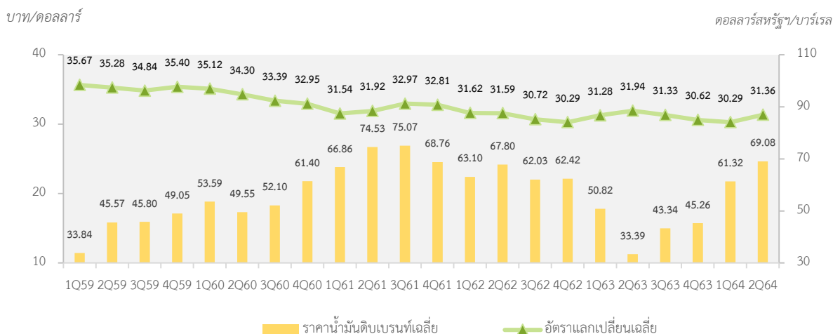
ตารางที่ 2: ราคาน้ำมันดิบเบรนท์เฉลี่ยและอัตราแลกเปลี่ยนเฉลี่ย