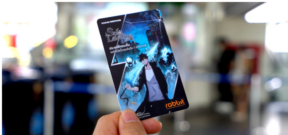
บัตรรับบิท Kakao Webtoon