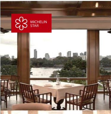
CÔTE BY MAURO COLAGRECO ได้รับรางวัล 1 ดาวมิชลิน และรางวัล Michelin Guide Service ปี 2565