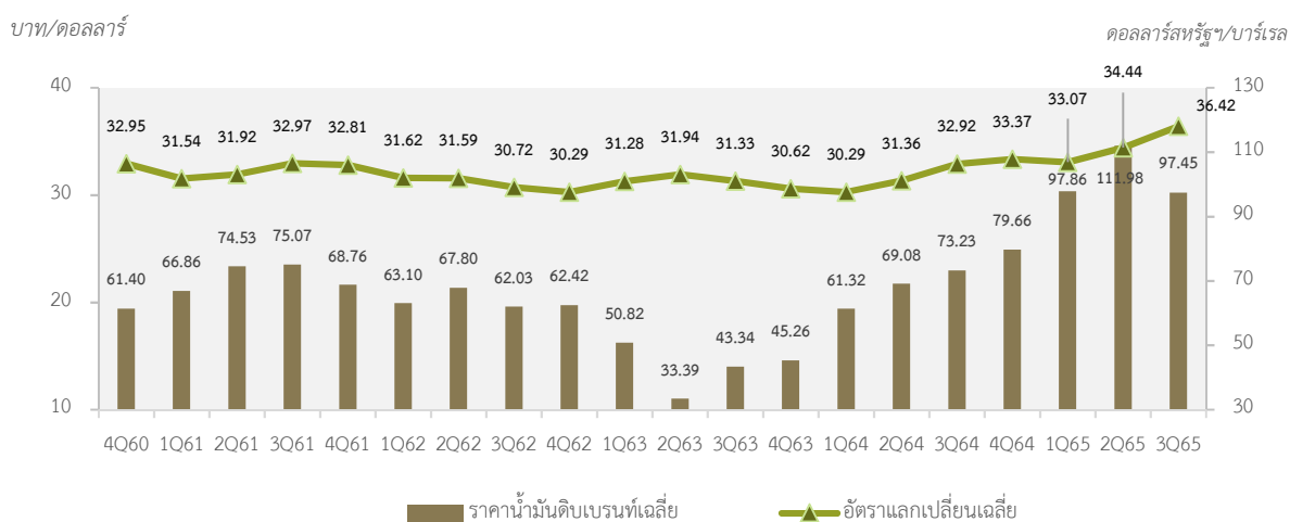
ตารางที่ 2: ราคาน้ำมันดิบเบรนท์เฉลี่ยและอัตราแลกเปลี่ยนเฉลี่ย

แหล่งที่มา: BOT, U.S. Energy Information Administration