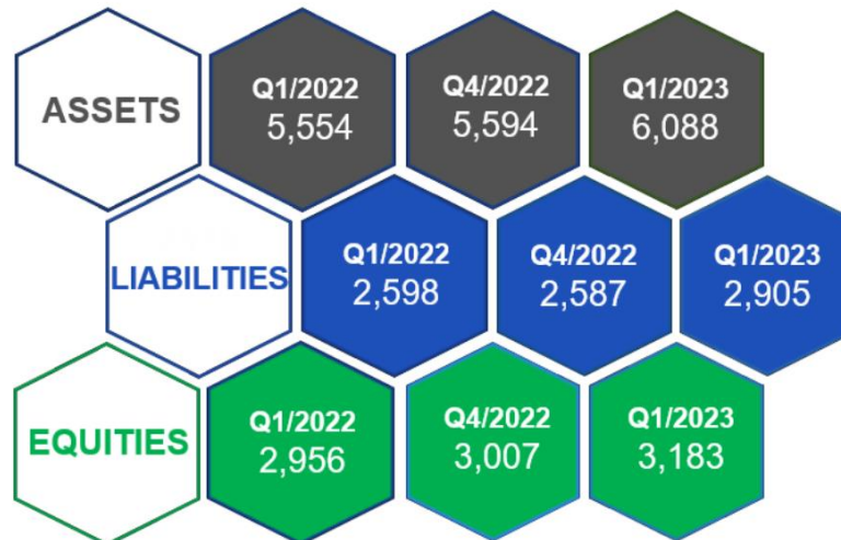
ภาพที่ 1: งบแสดงฐานะการเงินเปรียบเทียบ (แบบรายไตรมาส)

สาเหตุของการเปลี่ยนแปลงจากงบแสดงฐานะการเงินของกลุ่มบริษัท มีรายละเอียดดังต่อไปนี้