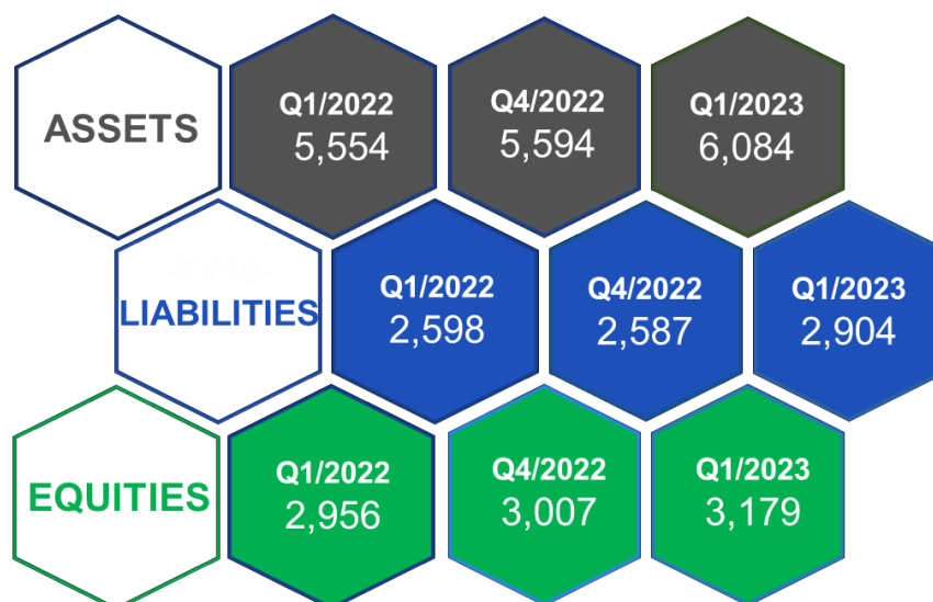
ภาพที่ 1: งบแสดงฐานะการเงินเปรียบเทียบ (แบบรายไตรมาส)

สาเหตุของการเปลี่ยนแปลงจากงบแสดงฐานะการเงินของกลุ่มบริษัท มีรายละเอียดดังต่อไปนี้