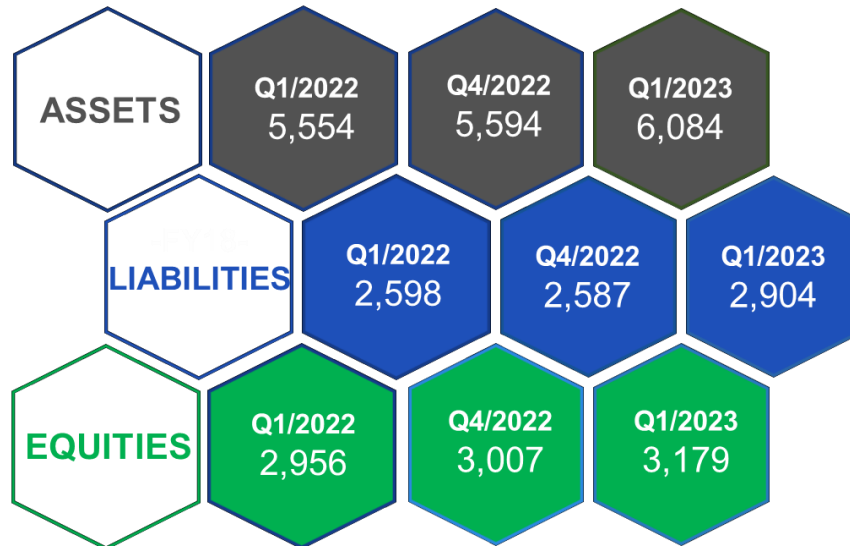
ภาพที่ 1: งบแสดงฐานะการเงินเปรียบเทียบ (แบบรายไตรมาส)

สาเหตุของการเปลี่ยนแปลงจากงบแสดงฐานะการเงินของกลุ่มบริษัท มีรายละเอียดดังต่อไปนี้