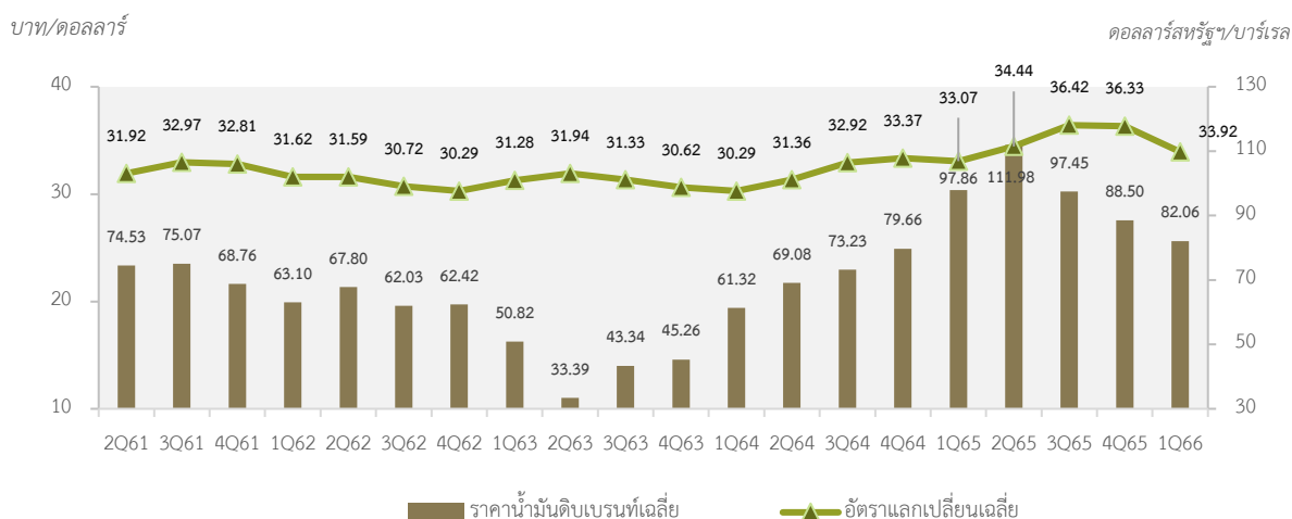
ตารางที่ 2: ราคาน้ำมันดิบเบรนท์เฉลี่ยและอัตราแลกเปลี่ยนเฉลี่ย

แหล่งที่มา: BOT, U.S. Energy Information Administration