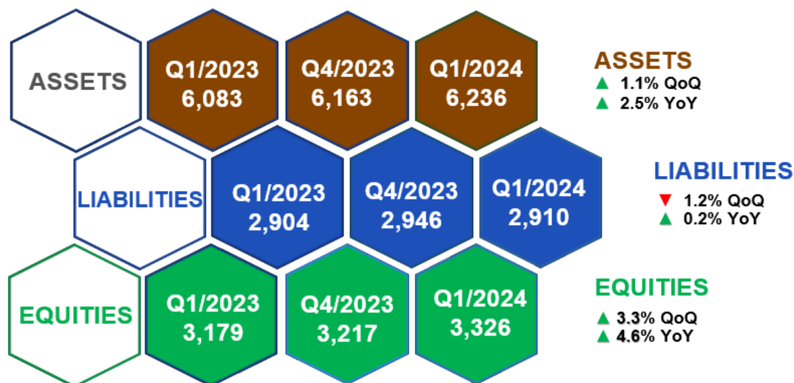
ภาพที่ 3: งบแสดงฐานะการเงินเปรียบเทียบ (แบบรายไตรมาส)

สาเหตุของการเปลี่ยนแปลงจากงบแสดงฐานะการเงินของกลุ่มบริษัท มีรายละเอียดดังต่อไปนี้