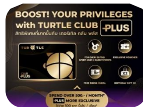
Turtle Club Plus