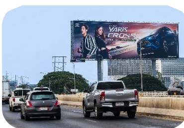
สื่อกลางแจ้งใน BTS MAX