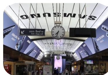
Samsung Galaxy S26