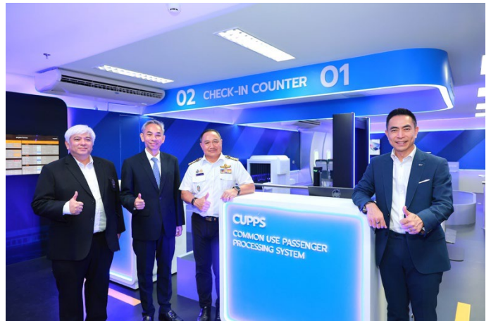
ผู้บริหารของบริษัทเข้าร่วมงานเปิดตัว "SKY Aviation Lab" ณ มหาวิทยาลัยเกษตรศาสตร์

3) สำหรับความคืบหน้าของบริษัทย่อยในกลุ่ม บริษัท โพร อินไซด์ จำกัด (มหาชน) ("PIS") ซึ่งเป็นบริษัทย่อยที่บริษัทถือหุ้นในสัดส่วนร้อยละ 67.70 ได้ประกาศผลการดำเนินงานประจำปี 2568 โดยมีรายได้รวม 3,132 ล้านบาท เพิ่มขึ้นร้อยละ 113 และมีกำไรสุทธิ 271 ล้านบาท เพิ่มขึ้นร้อยละ 163 เมื่อเทียบกับปีก่อนหน้า พร้อมทั้งมีโครงการที่รอรับรู้รายได้ในอนาคต (Backlog) จำนวน 3,494 ล้านบาท โดย PIS ได้ตั้งเป้าหมายการเติบโตของรายได้ในปี 2569 ที่ร้อยละ 10-15 จากการเข้าประมูลงานโครงการขนาดใหญ่อย่างต่อเนื่อง ความสำเร็จของ PIS ดังกล่าวสะท้อนถึงพลังของโครงสร้างธุรกิจแบบกลุ่มบริษัท (Group Synergy) และยืนยันว่าการดำเนินกลยุทธ์ Spin-Off ที่บริษัทดำเนินการในปี 2568 ให้ผลตอบแทนที่เป็นรูปธรรม