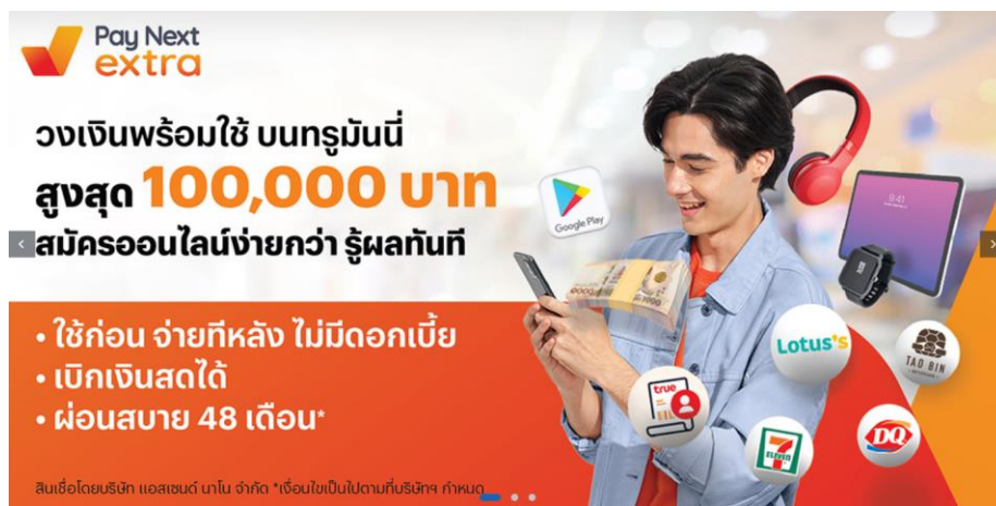
ตัวอย่าง การสื่อสารของผลิตภัณฑ์ Pay Next Extra

บริษัทฯ ได้มีการแบ่งกลุ่มทางการตลาดของลูกค้าเป้าหมาย โดยใช้ข้อมูลพฤติกรรมการใช้งานวอลเล็ตของลูกค้า รวมถึงพิจารณาในส่วนของข้อมูลความเสี่ยง เพื่อนำเสนอผลิตภัณฑ์ได้ตรงกับความต้องการของลูกค้า โดยวิธีการทางการตลาดจะเน้นการสื่อสารผ่านช่องทางแอปพลิเคชันทราฟฟ์นี้ ผ่านการสื่อสารข้อความที่เฉพาะเจาะจงกับลูกค้า เน้นความง่าย สะดวกในการสมัคร และความหลากหลายในการใช้งานของผลิตภัณฑ์ ทั้งนี้เพื่อให้เกิดการรับรู้ สนใจ และสมัครใช้ผลิตภัณฑ์